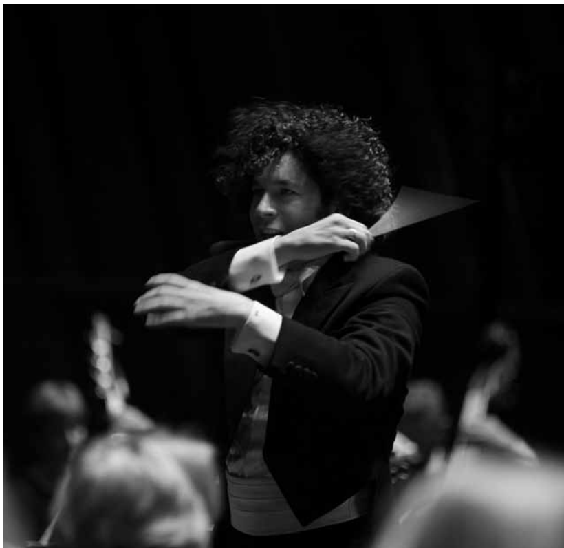
Toujours flamboyant : Gustavo Dudamel lors d'un précédent passage à la Philharmonie.

Cycle de concerts du Simón Bolívar Symphony Orchestra of Venezuela sous la direction de Gustavo Dudamel, à la Philharmonie les 10, 11 et 12 janvier à 20h.