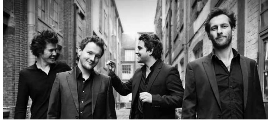
Das „Signum Saxophone Quartet“ bietet nicht nur Ohrenschaus sondern auch Augenkost an - ihr „visuelles Konzert“ findet am 17. Januar in der Philharmonie statt.