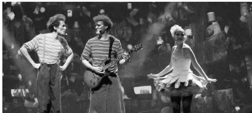
Les enfants aussi ont droit à leur comédie musicale : « Monsieur Timoté », le 10 janvier à la maison de la Culture d'Arlon.

Réckbléck 2015 , mat Jay Schiltz a Roll Gelhausen, Kulturhaus, Niederaanven, 20h. Tél. 26 34 73-1. AUSVERKAAFT!