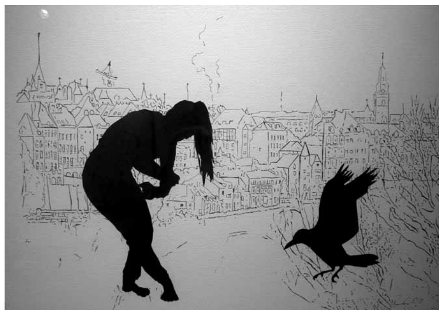
« Sans titre », dessin au stylo graphique et collage, 2013.

Faut-il pour autant renoncer à se déplacer rue de la Loge ? Non, car les œuvres évoquées plus haut sont heu-