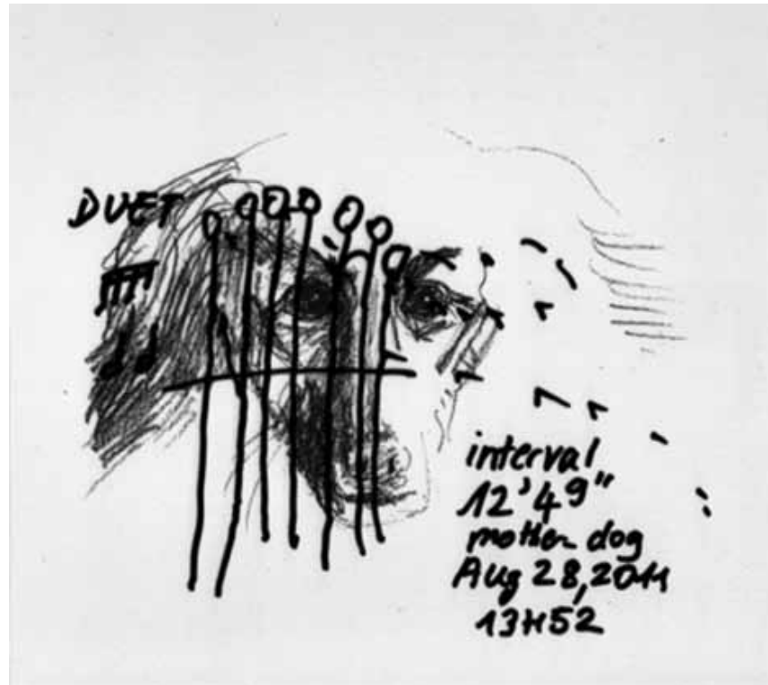
Une vie de chien ? « My Dog is My Piano » - performance de l'artiste Antonia Baehr, dimanche 24 janvier au Centre Pompidou de Metz.

Boooooooooom , mit der Noblet Dance Company, Studio des Theaters, Trier (D), 19h30. Tél. 0049 651 7 18 18 18.