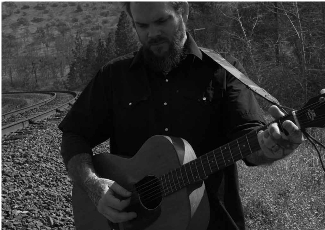
Düster geht auch ohne Strom.