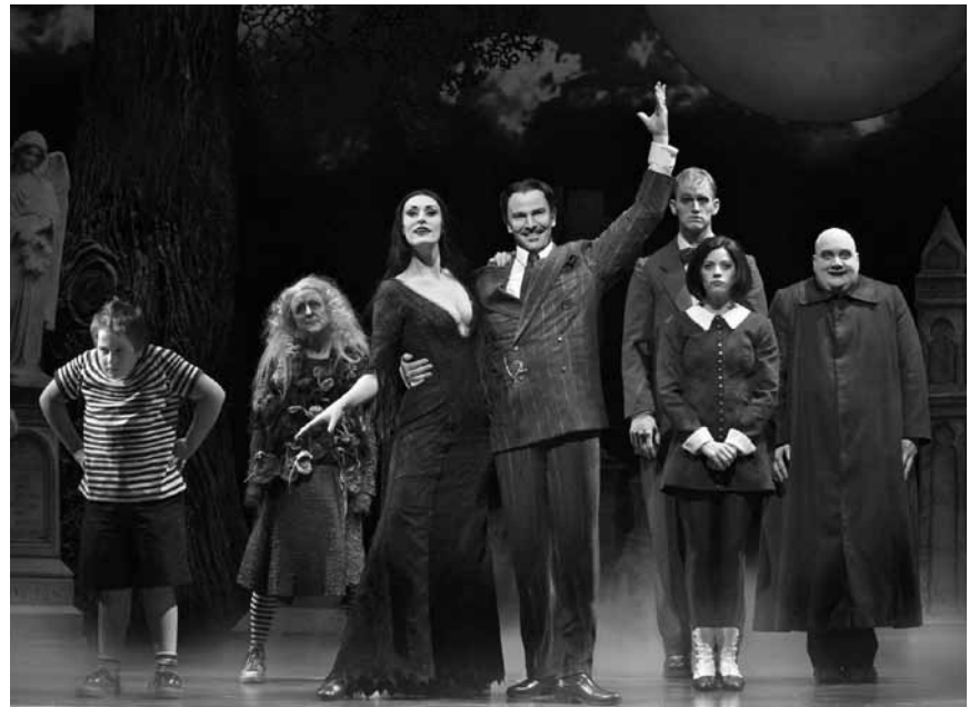
Die gruselige „Addams Family“ kehrt nach Merzig zurück! Im Zeltpalast an diesem Freitag, Samstag und Sonntag.