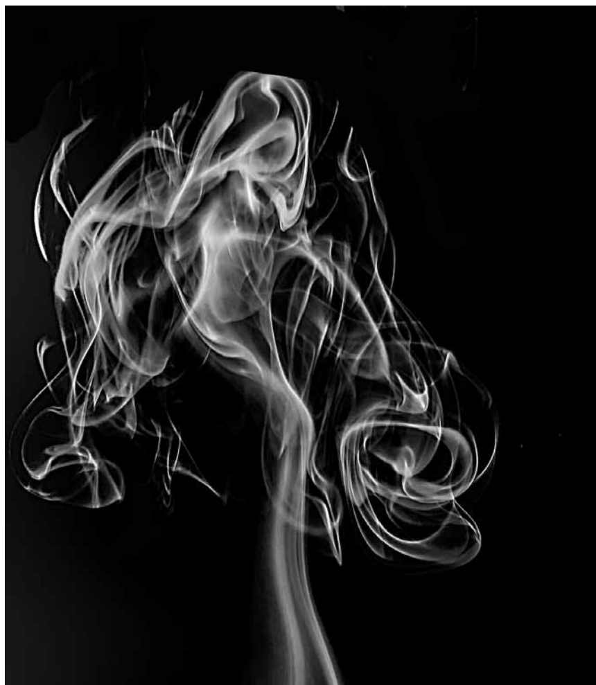
Tout part en fumée avec les photographies d'Aimé Collignon, jusqu'au 20 mars à la maison de la culture d'Arlon.