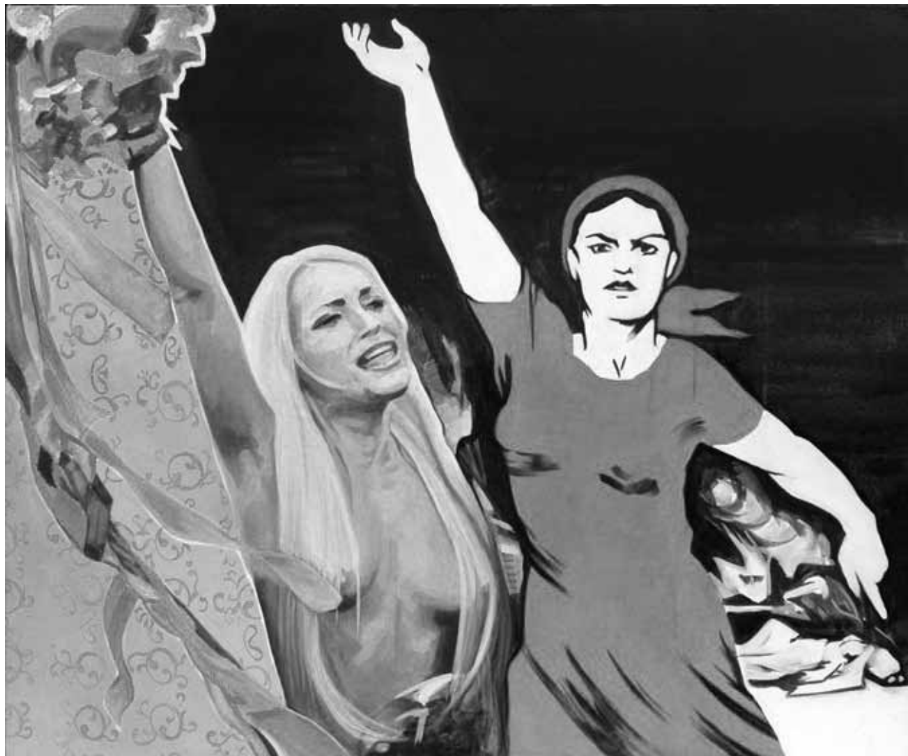
L'art s'invite même dans les lieux clos pour le quidam moyen... « People/Identities », de Susanne Strassmann, jusqu'au 10 mars au House 17.

œuvres des étudiants de l'atelier No Name de la Haute École des arts du Rhin de Strasbourg, Kunschthaus beim Engel (1, rue de la Loge, tél. 22 28 40), jusqu'au 21.2, ve. - sa. 10h - 12h + 13h - 18h30, di. 15h - 18h.