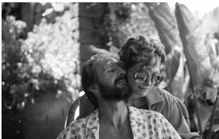
Comme quoi la campagne italienne n'est pas que luxe, calme et volupté - du moins pour les rockstars américaines : « A Bigger Splash » - à l'Utopia dans le cadre du « Luxembourg Film Fest ».