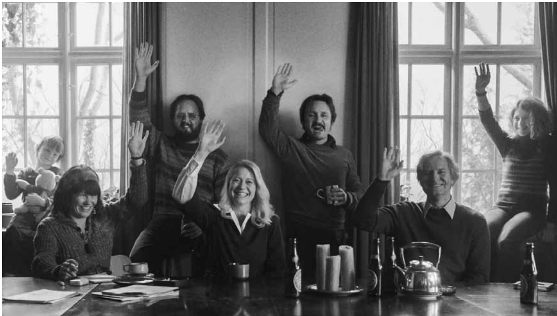
Tous d'accord pour tenter l'expérience communautaire.