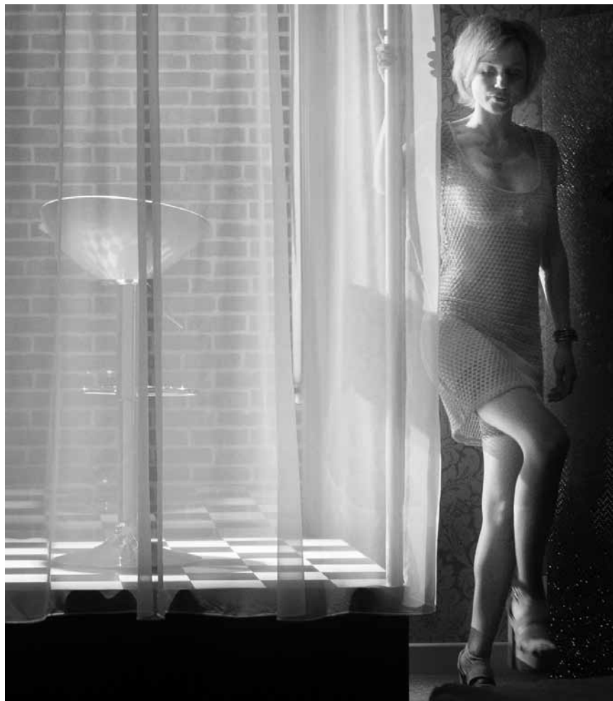
« Belles de nuit » une histoire sur la prostitution et l'amour - à la Maison de la Culture d'Arlon le 9 mars.

One of These Nights , tribute to the Eagles, Alte Feuerwache,