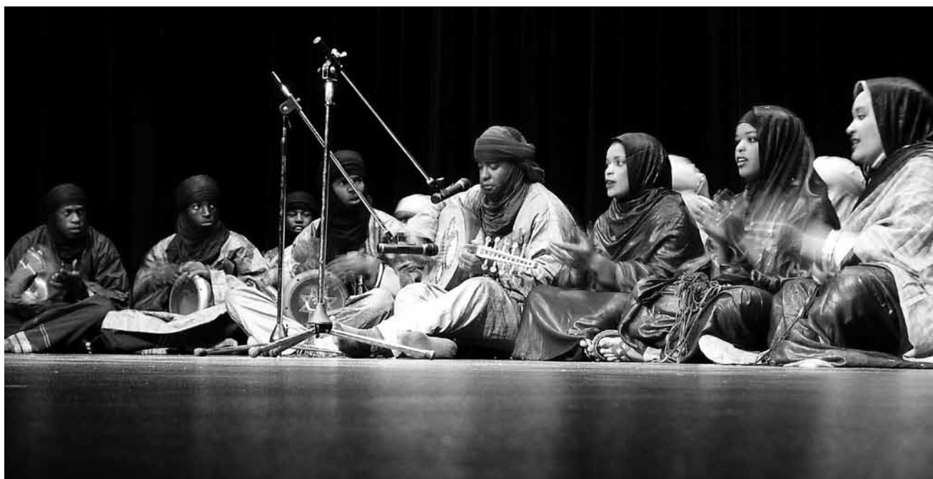
La beauté du désert et la mélancolie de la vie dure des Touaregs sont réunies dans la musique d'Indjaran - à voir et à vivre le 14 mars à l'abbaye de Neumünster.

Georges & Georges , d'Éric-Emmanuel Schmitt, Théâtre, Esch , 17h. Tel. 54 09 16 / 54 03 87. COMPLET !