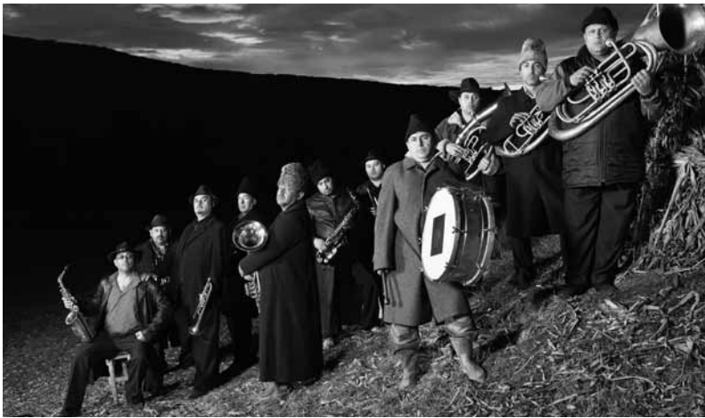
Bringt Schwung in die Philharmonie: Fanfare Ciocarlia.