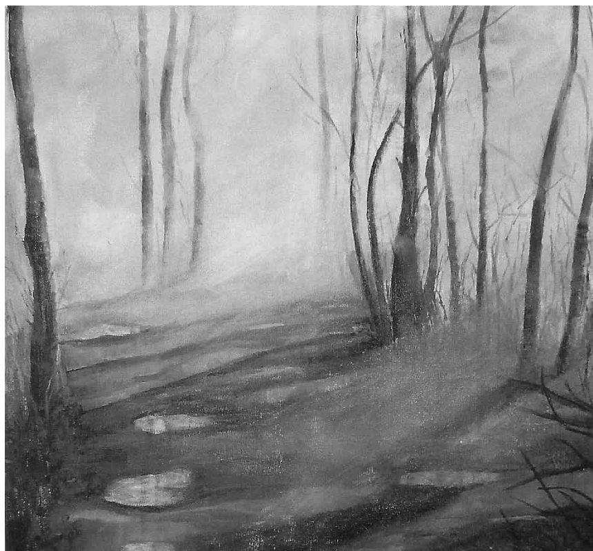
Deemno wéi kennt een sech do ganz kleng vir: „Am Risen- an am Zwergeräich“ vun der Gaby Didier - vum 26. März bis den 8. Abrëll an der Galerie Dënzelt zu Ierchternach.