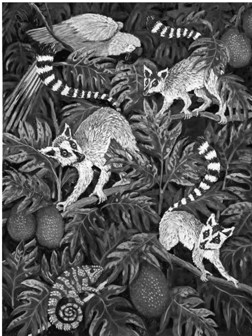
Mais c'est merveilleux ! Les peintures animalières de Marc Wagner seront au Parc Merveilleux à Bettembourg jusqu'au 16 avril.