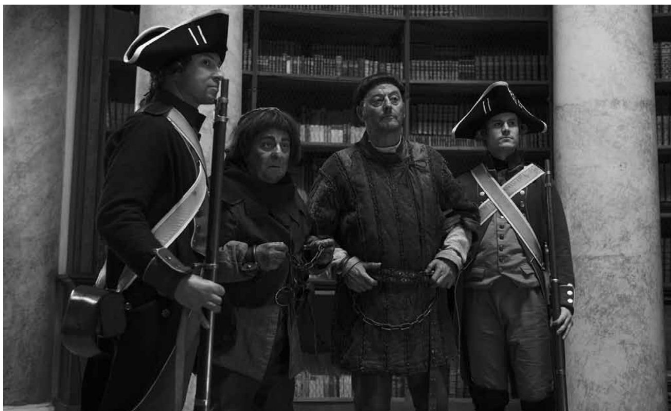
Ils hantent toujours les couloirs spatio-temporaux - et les salles obscures - dans « Les visiteurs 3 » Godefroy de Montmirail et son Jacquouille débarquent pendant la Révolution française - nouveau au Ciné Ermesinde, Ciné Waasserhaus, Kursaal, Utopolis Belval et Kirchberg.

Vermählung von Toula und Ian Miller vergangen, die beiden immer noch ein Paar. Wobei es im Arbeits- und Familienalltag gar nicht so leicht ist, die Beziehung frei von Ärger zu halten - woran nicht zuletzt ihre Teenager-Tochter Paris Schuld ist, die es in die Ferne zieht.