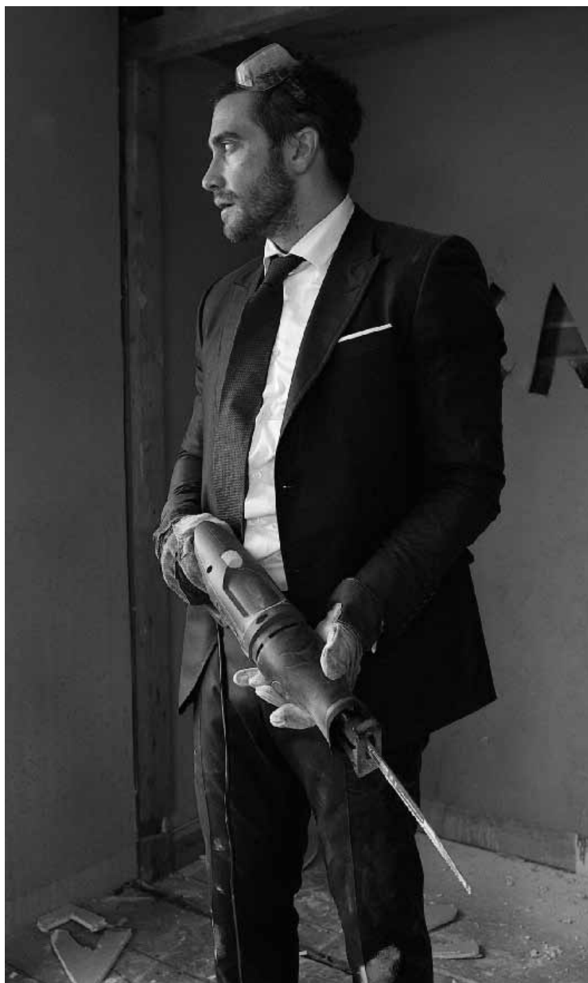
In „Demolition“ muss ein frisch verwitweter Investmentbanker den Sinn des Lebens wiederentdecken - neu im Utopolis Kirchberg.

Das Leben des jungen und erfolgreichen Investmentbankers Davis Mitchell wird in seinen Grundfesten erschüttert, als seine Ehefrau bei dem Verkehrsunfall, bei dem er nur leicht verletzt wurde, ums Leben kommt. Er beginnt, sein bisheriges Leben, die Gesellschaft und den amerikanischen und konstitutionell verbrieften Geist des "Pursuit of Happiness" zu hinterfragen. Die Bekanntschaft mit Karen Mareno und ihrem Sohn Chris rüttelt Davis gehörig auf und eröffnet die Chance auf einen Neuanfang - auch wenn das bedeutet,