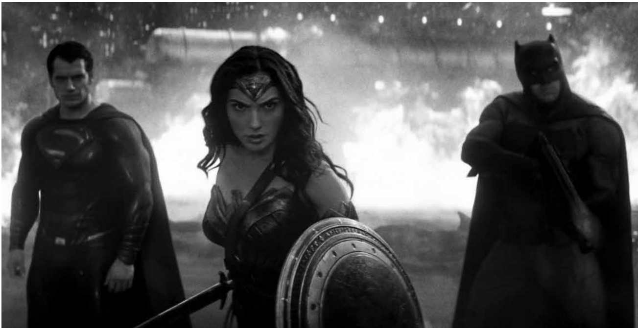
Superman, Batman und Wonder Woman - die Frau die allen beiden wieder gutes Benehmen beibringt.