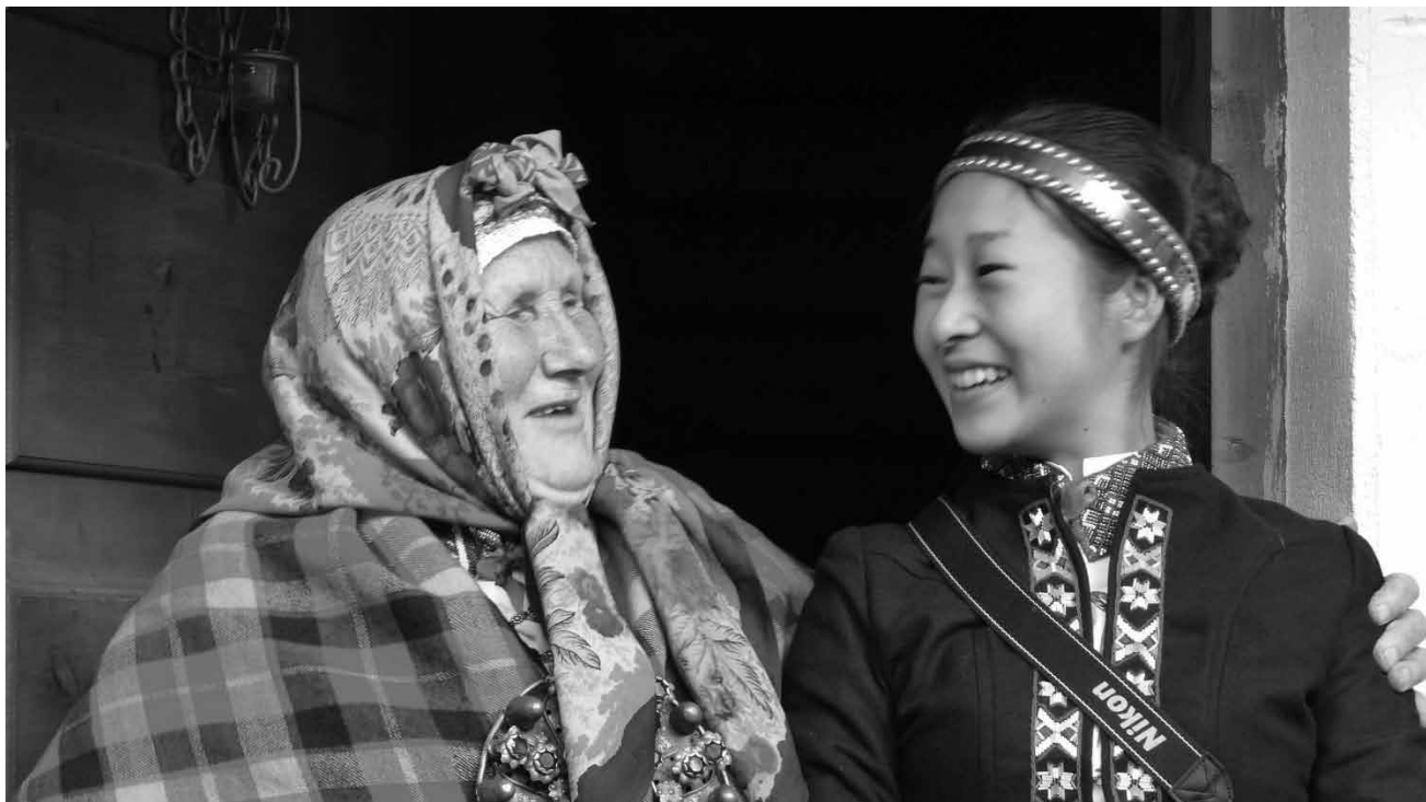
"Ruch & Norie" - a documentary by Inara Kolmane tells the extraordinary story of the friendship between a young Japanese student and a 82-year-old woman belonging to the Suiti community in Latvia - Friday, April 15th at the Cinémathèque.