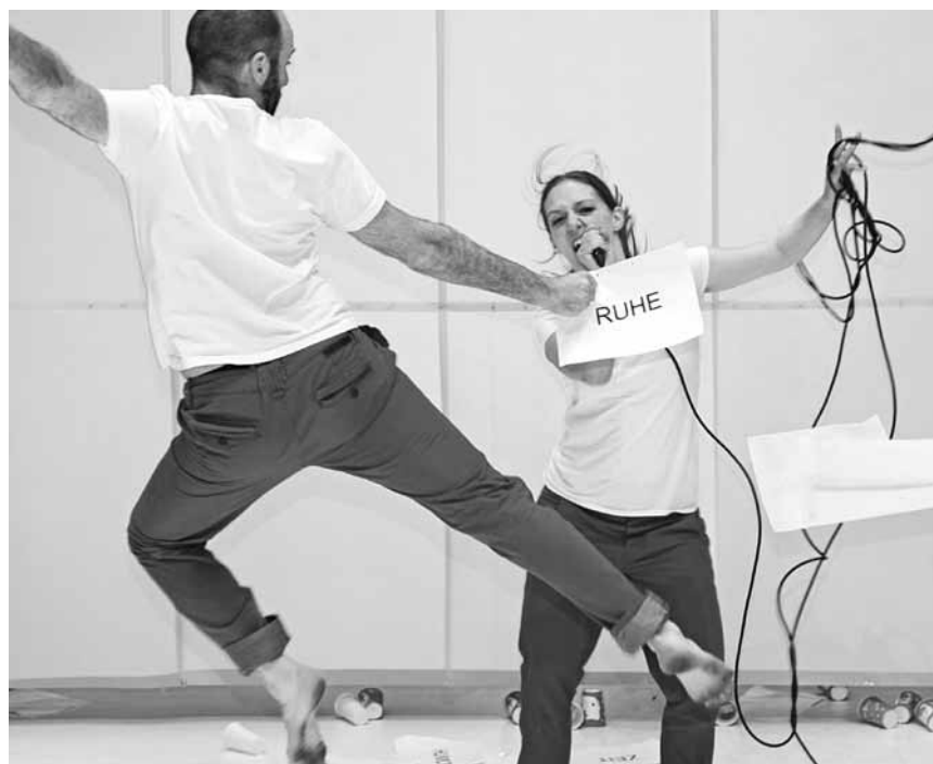
Plastikbecher, ökologische Intelligenz und viel Spaß an der Sache bringen die Performer der „Trashedy Performance Group“ am 14. April in die Rotondes.

Die Schutzbefohlenen , Stück von Elfriede Jelinek, Alte Feuerwache, Saarbrücken (D), 19h30. Tel. 0049 681 30 92-0.