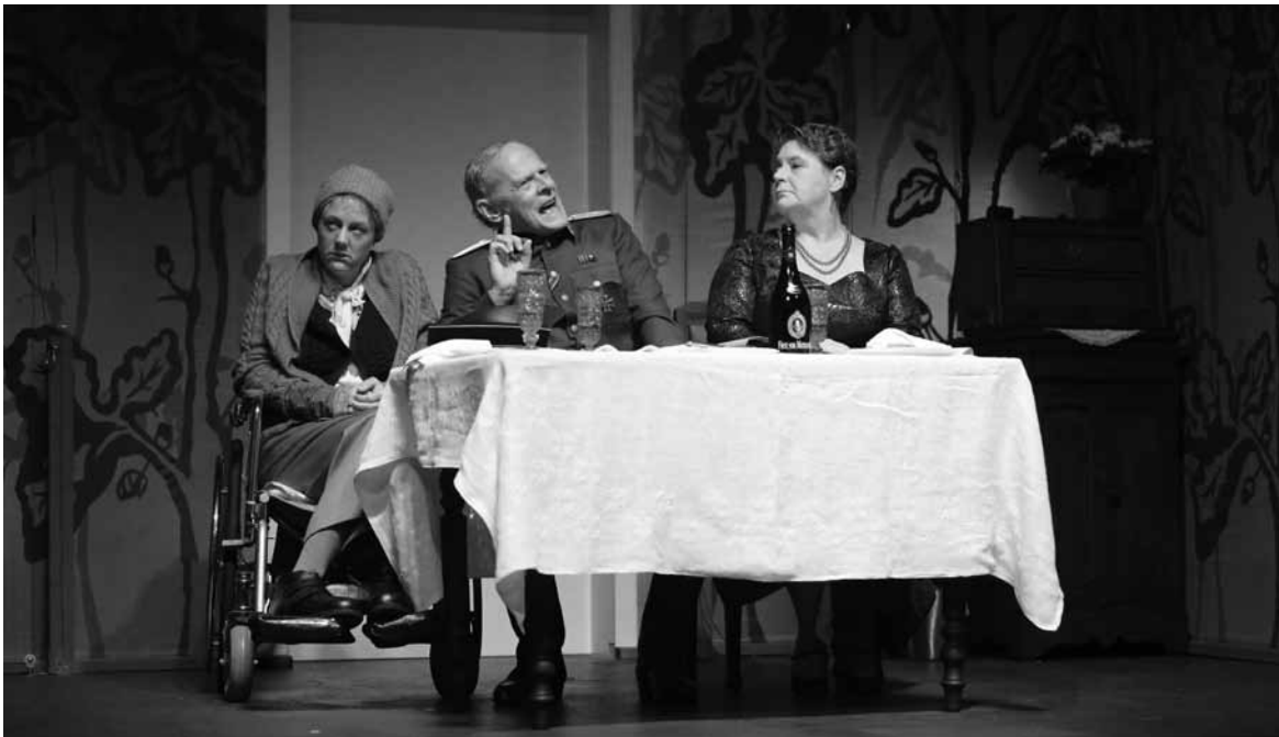
Wohl kaum im Sinne Thomas Bernhards: Gelungenes Bühnenbild, gähnende Langeweile.