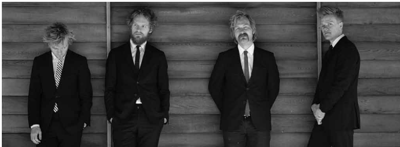
Le 20 avril au Cape Ettelbrück, le Danish String Quartet revisitera des pièces de Beethoven, Haydn et des musiques traditionnelles.

Maka MC + BC One + D. Fluit + Chris Thomas + Freshdax + Mammamia + Dusty D + DJ Funkstar , café-théâtre Rocas (place des Bains), Luxembourg , 20h. Tél. 27 47 86 20.