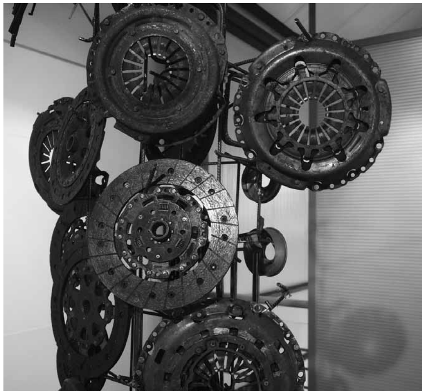
Probablement très intéressant : « Mécaniques improbables », à l'espace Beau Site d'Arlon jusqu'au 15 mai.