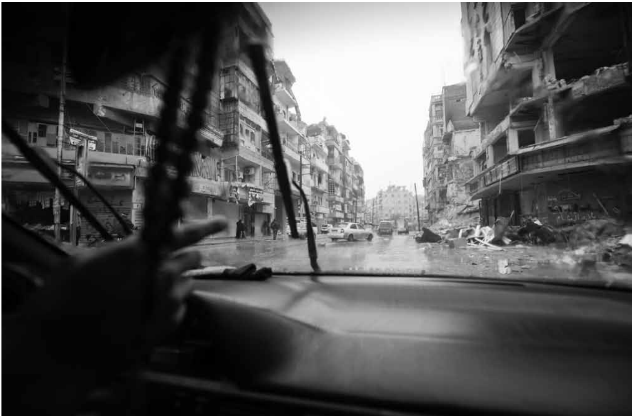
Eine rein rhetorische Frage: „Nie wieder Krieg ?!“ - Fotografien von Boris Niehaus in der Alten Feuerwache Saarbrücken - bis zum 19. Juni.

tél. 47 23 24), du 29.4 au 4.6, ma. - ve. 10h - 18h30, sa. 10h - 17h.