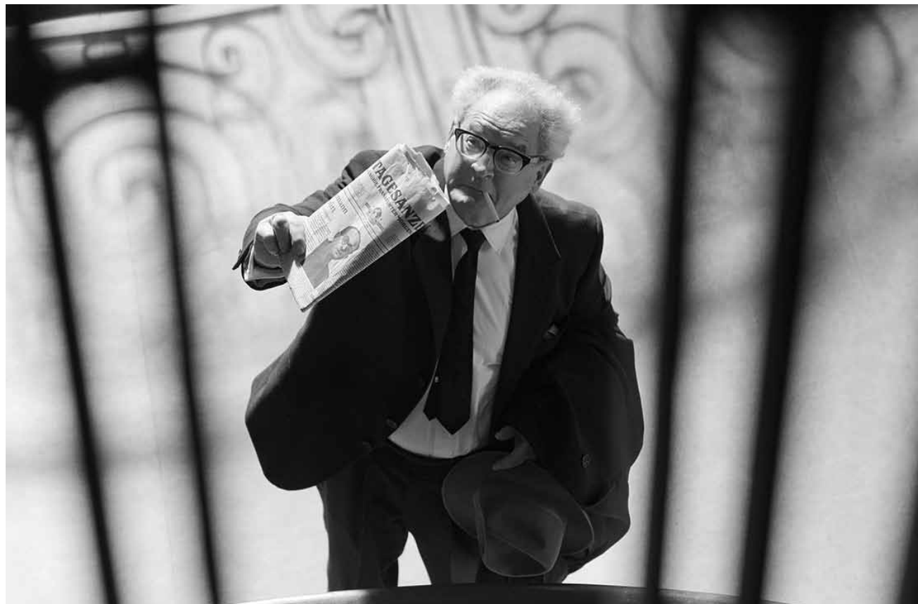
Allein gegen die Altnazis: „Der Staat gegen Fritz Bauer“ dokumentiert den einsamen Kampf eines Staatsanwalts um die Holocausttäter vor Gericht zu stellen - neu im Utopia.

☒ (...) pas vraiment un navet ; mais (...) un peu comme l'investissement dans une holding : on vous promet beaucoup pour un rendement pas vraiment mirobolant à la fin. Dommage, car toute l'équipe qui y a travaillé sait décidément mieux faire. (lc)