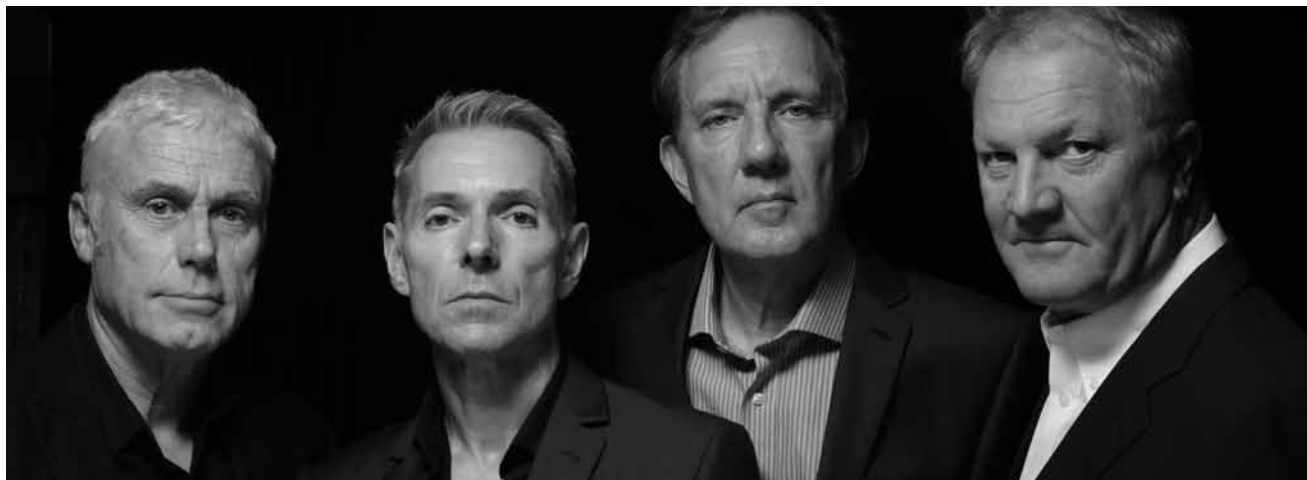
What's up « Dr. Feelgood »? Si vous voulez le savoir, alors prenez rendez-vous le 29 avril au Gueulard à Nilvange.

Être ou paraître + Les chaises ? Soirée Marie-Claude Pietragalla & Julien Derouault, par la cie Théâtre du corps, centre culturel La Passerelle,