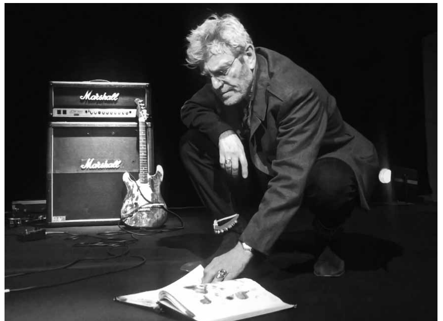
L'acteur et musicien Tchéky Karyo réunit le meilleur de ses deux mondes pour la pièce « Jimi Hendrix » - les 29 et 30 avril au TNL.