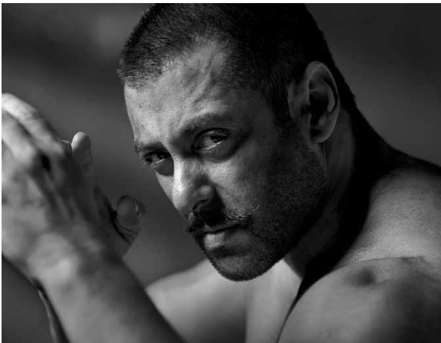
Er ringt im wahrsten Sinne des Wortes um sein Überleben: „Sultan“ - wird Fans des indischen Kinos auch diese Woche ins Utopolis Belval locken.