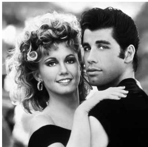
Manche lieben es fettig: „Grease“ am Samstag im Open Air Cinema am Palast.

Danny ist Anführer der coolen „T-Birds“ vom Rydell-College. Während eines Strandurlaubs hat er einen Flirt mit Sandy die nach den Ferien das College wechselt und in Rydell landet. Da hat Danny ein Problem und will nichts von ihr wissen. Sandy wird Mitglied der Frauengang „Pink Ladies“.