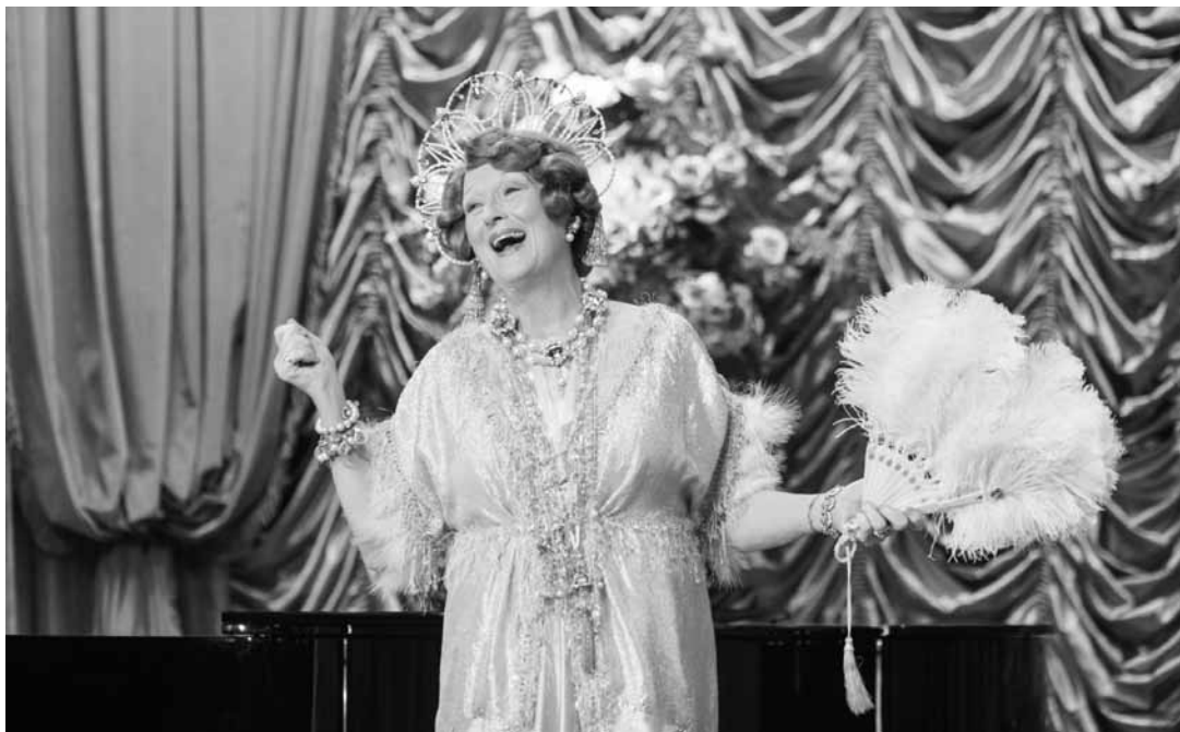
Meryl Streep chante faux avec précision dans un rôle un peu juste pour son talent.