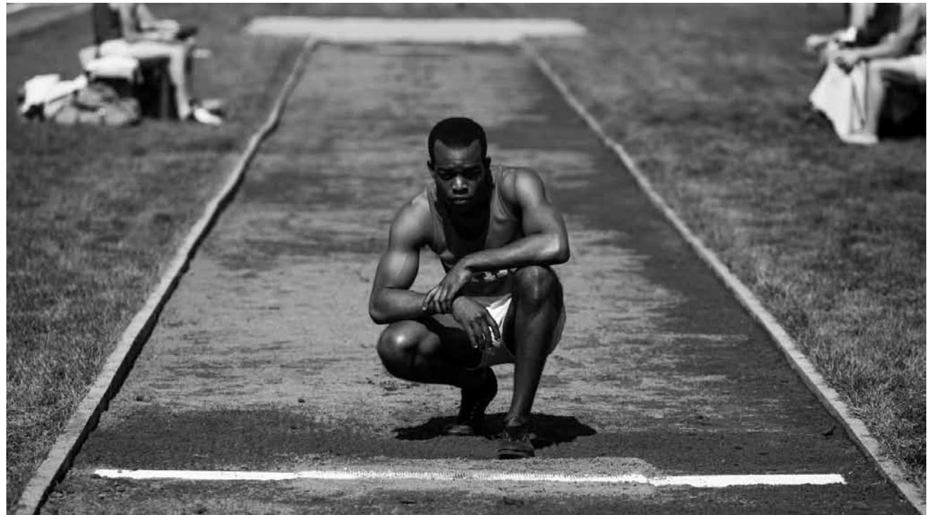
Der Athleten-Legende Jesse Owens wird mit „Race“ gewürdigt: Passend zum baldigen Start der Olympischen Spiele läuft der Film des australischen Regisseurs Steven Hopkins ab dieser Woche im Utopolis Kirchberg an.