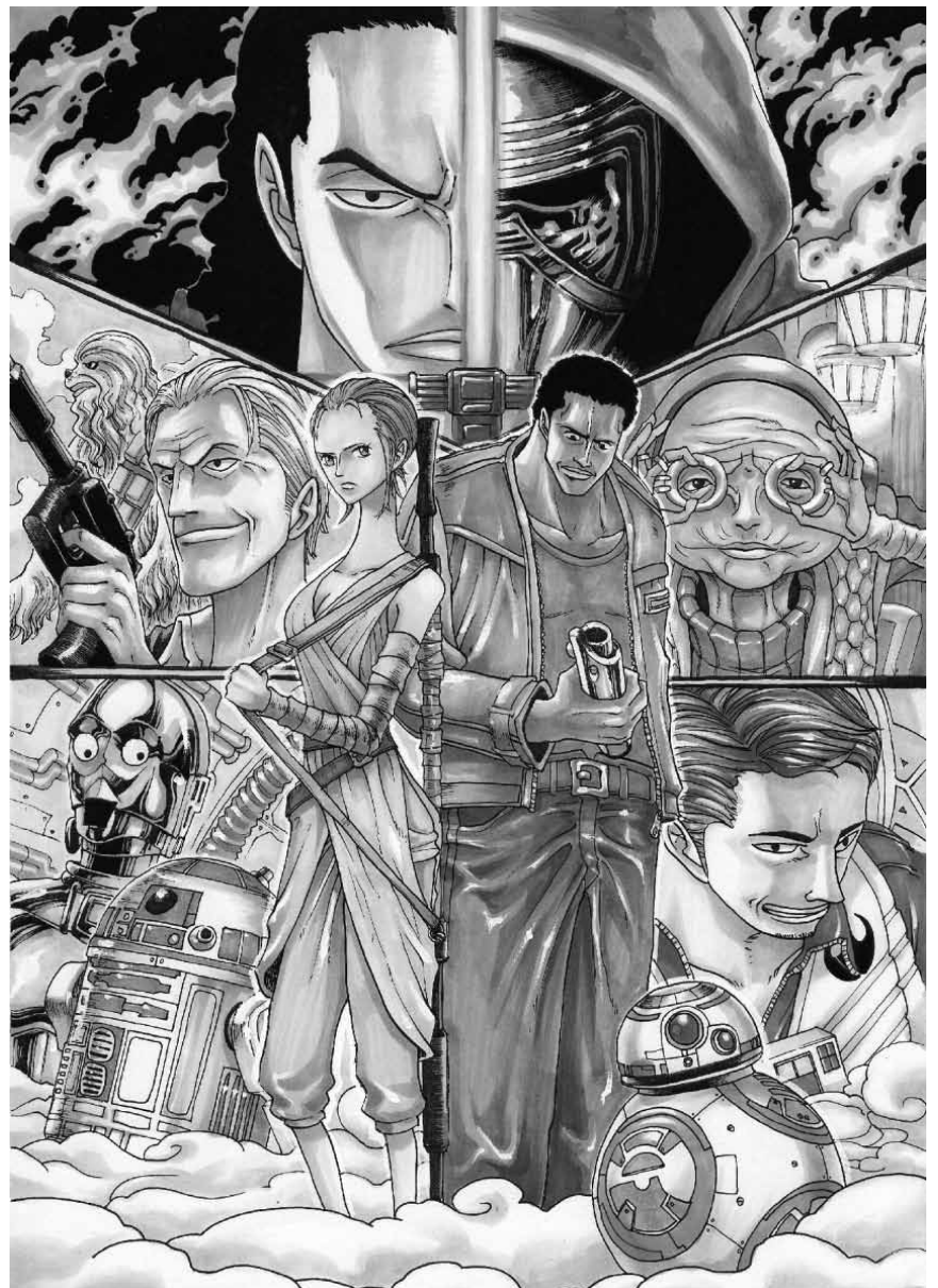
Schon die 13. Episode der in Japan sehr populären Mangaserie „One Piece.“ Jetzt schafft es die neue Produktion „Gold“ an diesem Samstag, dem 23. Juli erstmals in gleichzeitig 33 Ländern in die Kinosäle.