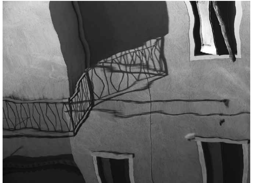
Parfois le monde n'est qu'un reflet : « I Wanted to See the World », photographies de Jessica Backhaus, à l'Échappée belle à Clervaux - jusqu'au 30 septembre.