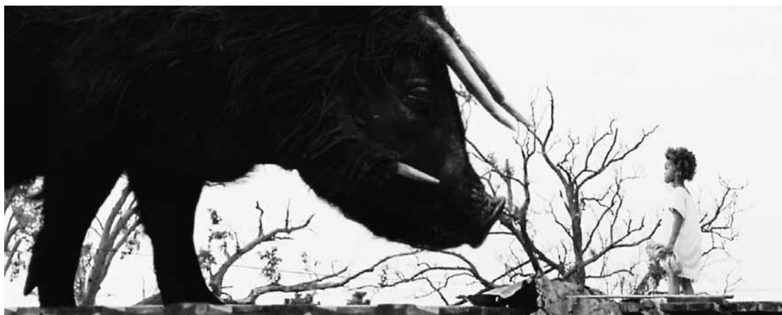
Ein magischer und herausfordernder Film aus dem Jahre 2012: „Beasts of the Southern Wild“ - Im Open Air Kino.