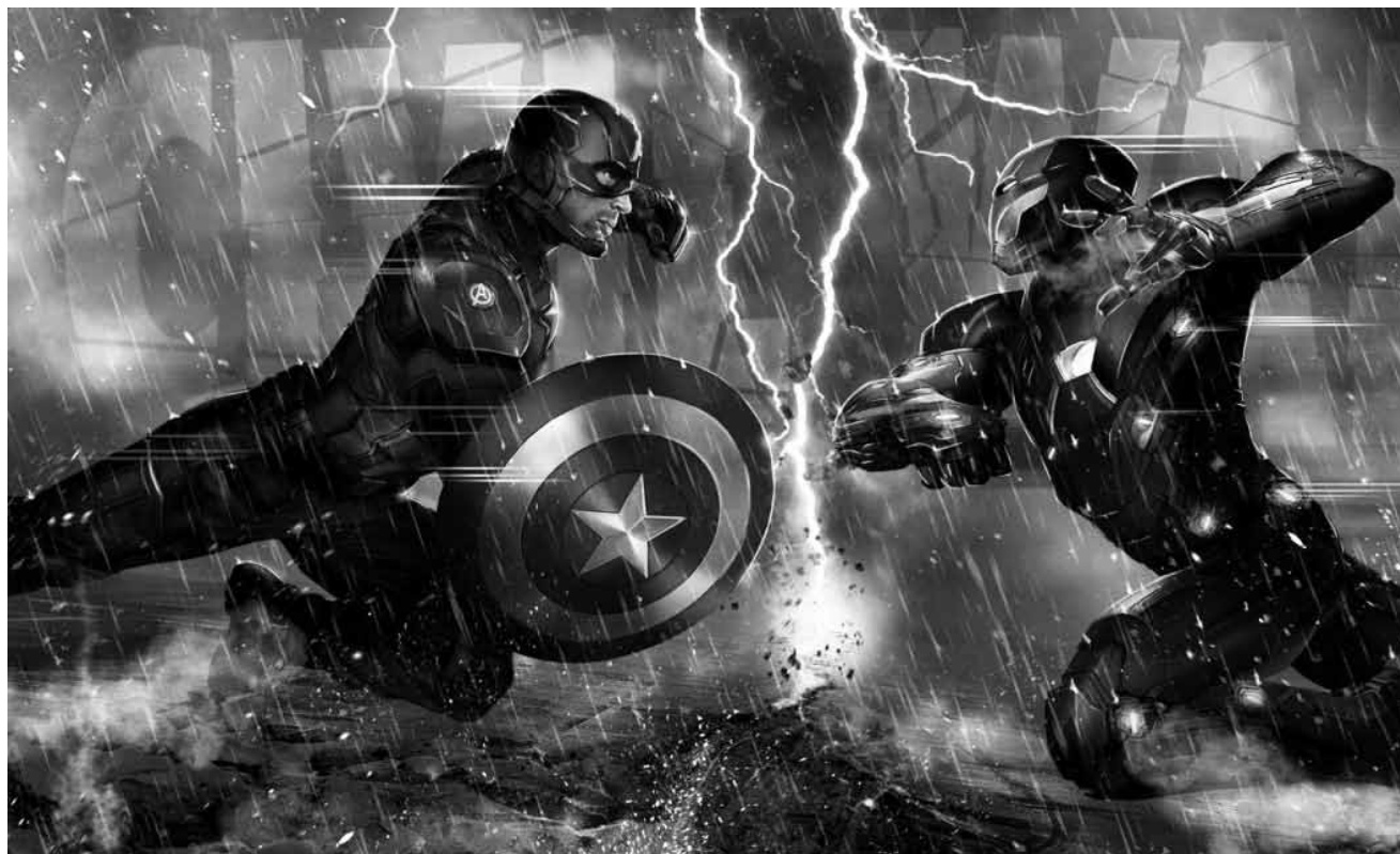
Ordentlich was auf die Schnauze: In „Captain America: Civil War“ treten gleich mehrere Superhelden gegeneinander an - am Montag im Open-Air-Kino in Diekirch.

Die Teenage Mutant Ninja Turtles müssen es nicht nur mit Erzfeind Shredder aufnehmen, sondern auch mit seinen mutierten Handlangern sowie dem wahnsinnigen Wissenschaftler Baxter Stockman und dem Alien-Kriegsherrn Krang. Glücklicherweise steht den humanoiden Schildkröten weiterhin Reporterin April O'Neil im Team mit Kameramann Vern zur Seite.