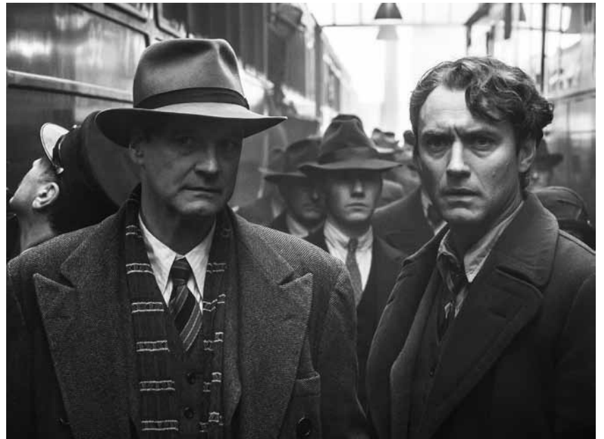
In einer Zeit als noch ordentlich lektoriert wurde: „Genius“ erzählt die schwierige Beziehung zwischen Lektor Max Perkins und Autor Thomas Wolfe - neu im Utopia.

Biopic über das Leben und Schaffen von Florence Foster Jenkins, die als schlechteste Opernsängerin aller Zeiten in die Geschichte einging - wegen ihres furchtbaren Gesangs. Ihr Manager St Clair Bayfield versucht Florence vor der unbequemen Wahrheit zu schützen. Das wird besonders schwer, als die Sängerin