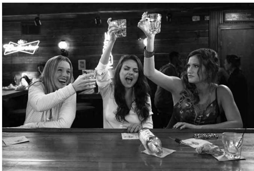
Thematisiert den Alltagsstress von drei überforderten Müttern in einer Komödie: „Bad Moms“ wird wohl mehr als eine Frau verärgern. Neu im Utopolis Belval und Kirchberg