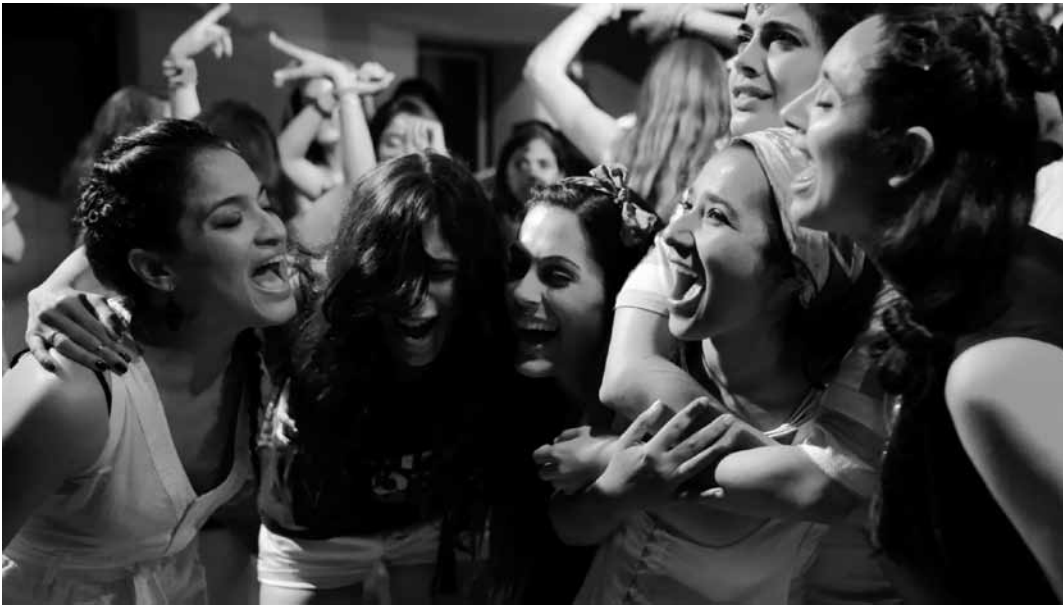
On sait s'amuser dans le premier « buddy movie » féminin produit en Inde.