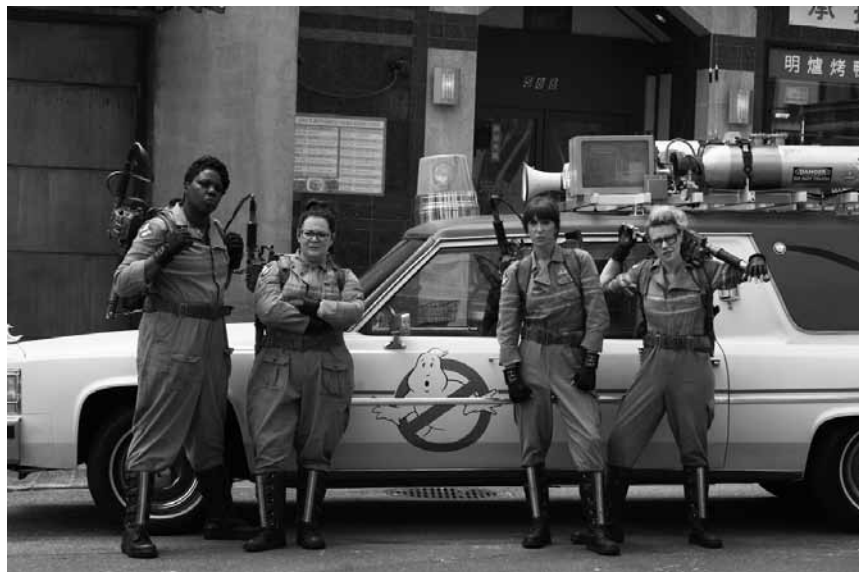
Tja, nun müssen die Frauen ran um New York vor Geistern und Hollywood-Schreiber vor neuen Ideen zu retten: „Ghostbusters“ - Vorpremiere im Utopolis Belval und Kirchberg.

✖✖✖ Paolo Virzì signe un film à l'énergie communicative où Valeria Bruni Tedeschi et Micaela Ramazzotti brillent de mille feux dans un duo mémorable. Les scènes communes où elles font étal de leurs qualités d'actrices dans tous les registres sont au cœur du récit et estompent le brin de sentimentalisme qu'un spectateur pointilleux pourrait détecter. (ft)