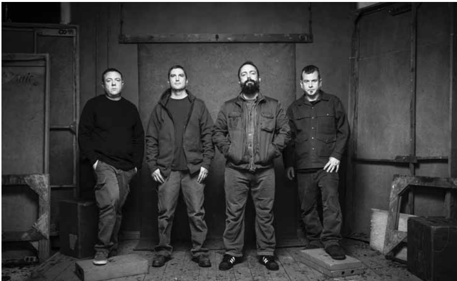
Clutch - groupe à constance indéterminée.