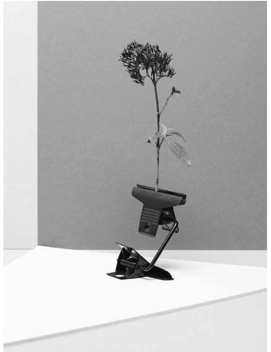
Ein weites Feld das Anne Mühler und Nico Schmitz da beackern: „Field Works“ - die Fotoausstellung ist noch bis zum 17. Mai 2017 im Garten des „Bra'haus“ in Clervf zu sehen.