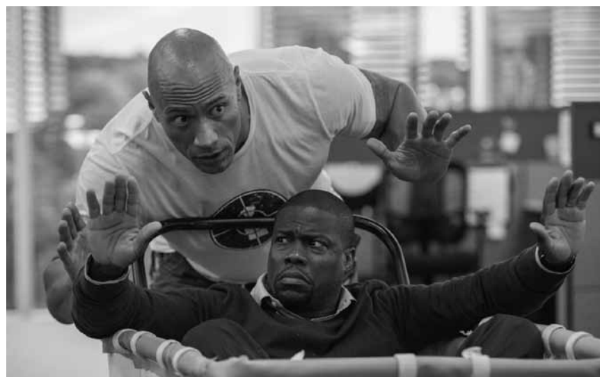
Was daran wirklich intelligent sein sollte, erschließt sich nicht aus dem Trailer: „Central Intelligence“ - neu im Utopolis Belval und Kirchberg.