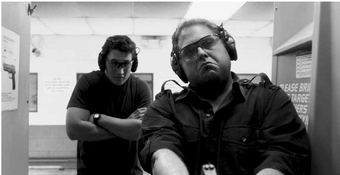
Lustiger Krieg? Die Macher der „Hangover-Trilogie“ haben es versucht: „War Dogs“ - neu im Utopolis Belval und Kirchberg.

erhält er einen Auftrag direkt vom Parlament: Als Sonderbotschafter für Handelsfragen soll Tarzan zurück in den Dschungel geschickt werden.