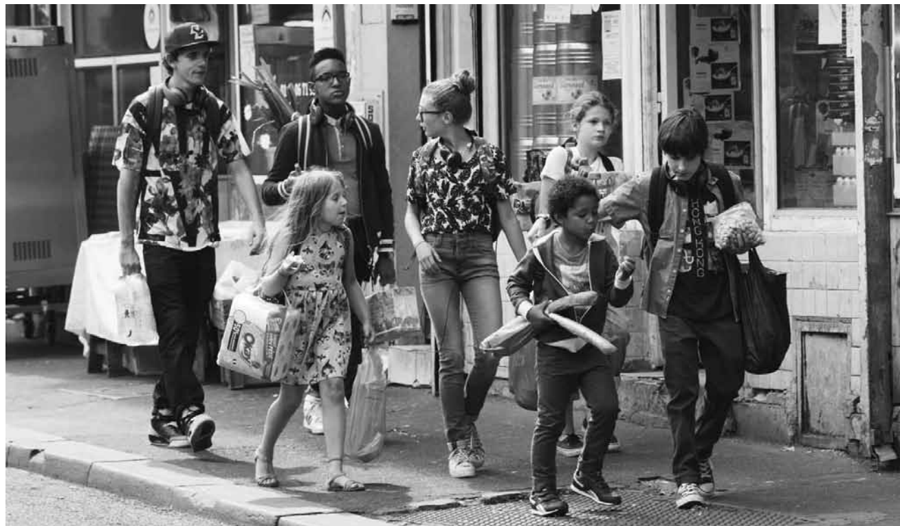
Les familles recomposées et... boostées au max : « C'est quoi cette famille ? » - nouveau à l'Utopolis Kirchberg.

Buchhalter, der hin und wieder noch immer sehnsüchtig an seine wilderen Tage denkt. Aus Bob ist hingegen ein obercooles Muskelpaket geworden, das als Top-Spion für die CIA arbeitet.