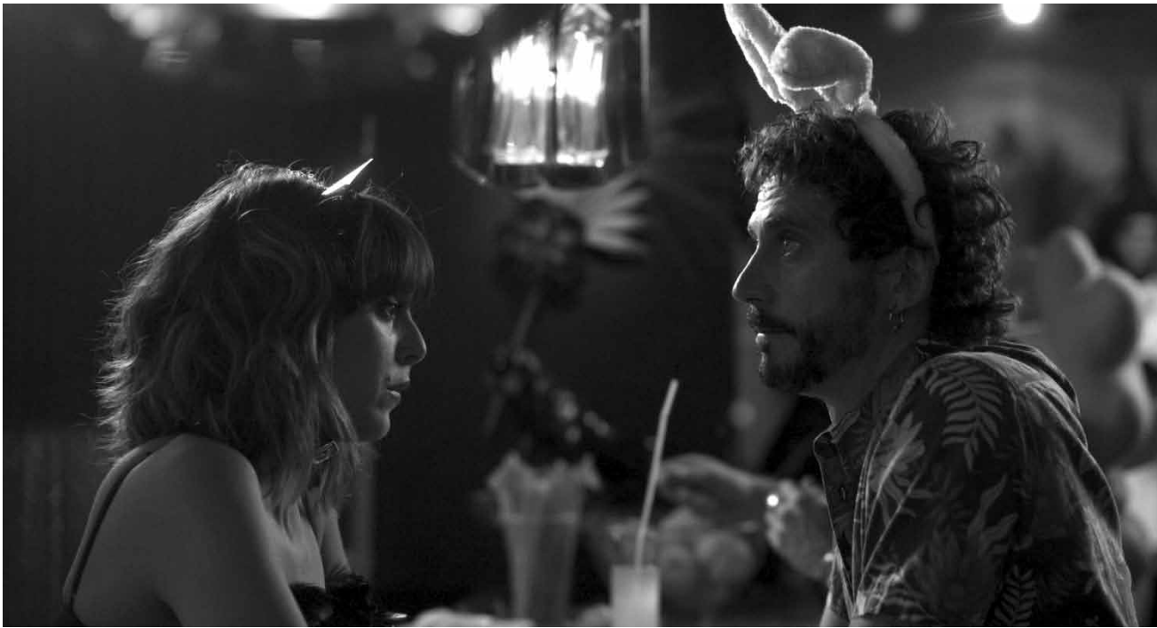
Cinq histoires, cinq destins et cinq amours : «Kiki, el amor se hace» de Paco León - nouveau à l'Utopia.

Gegner des totalitären Regimes. Die rebellische Julia verliebt sich in ihn, was unter der herrschenden Partei jedoch als Straftat gilt, da Verbindungen zwischen Mann und Frau nur der Fortpflanzung dienen dürfen.