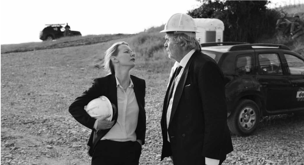
Wenn der Papa sich zum Toni wandelt...