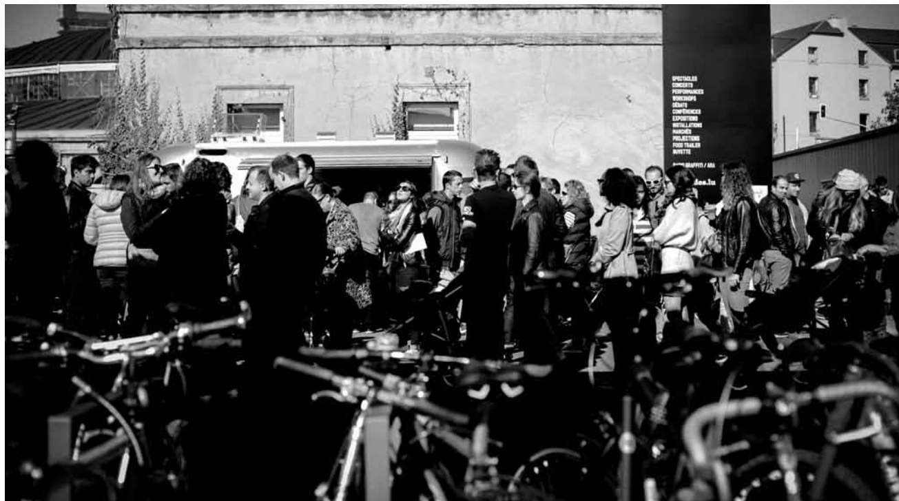
Une grosse baffe pour les automobilistes : les 26 et 27 août, les Rotondes se placent sous le signe du vélo avec le BAFF - Bicycle Art and Film Festival.

Les forts Thüngen et Obergrünwald , visite guidée avec Célestin Kremer et