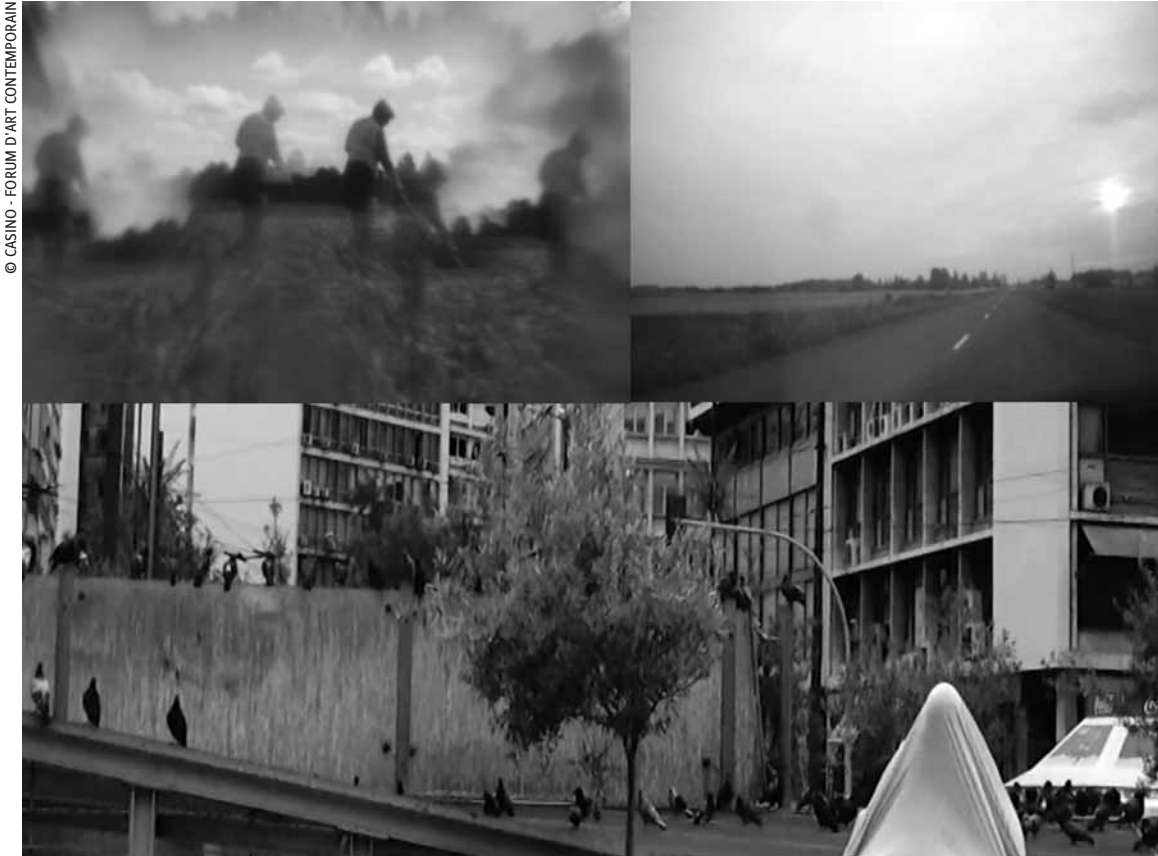
© CASINO - FORUM D'ART CONTEMPORAIN