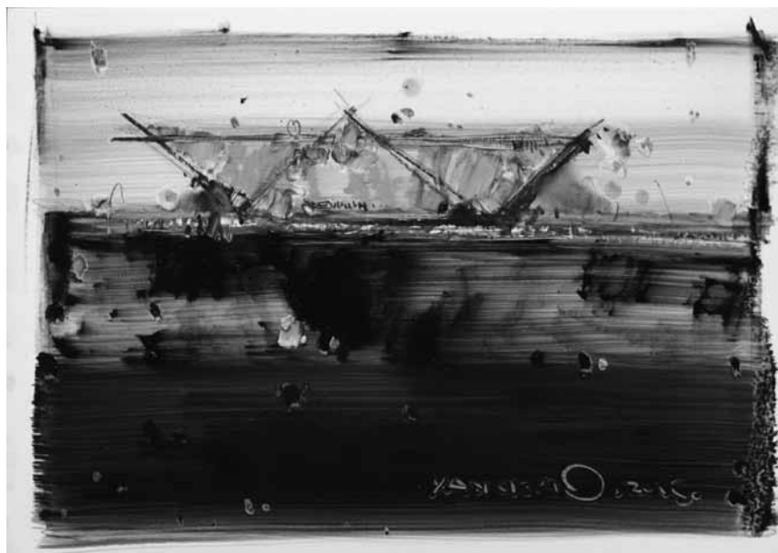
La Chine fascine... et en plus ça rime : « Fascination chinoise » - à la galerie de la maison de la culture de Diekirch, jusqu'au 2 octobre.