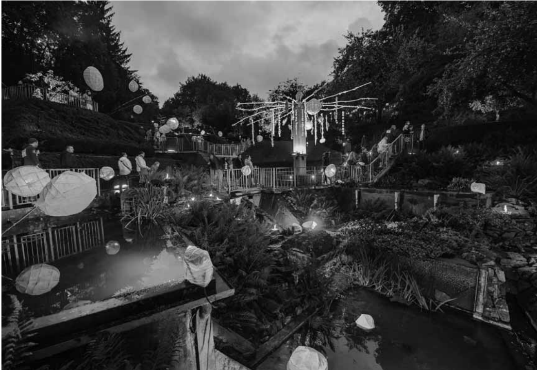
Lampions et plus si affinités.