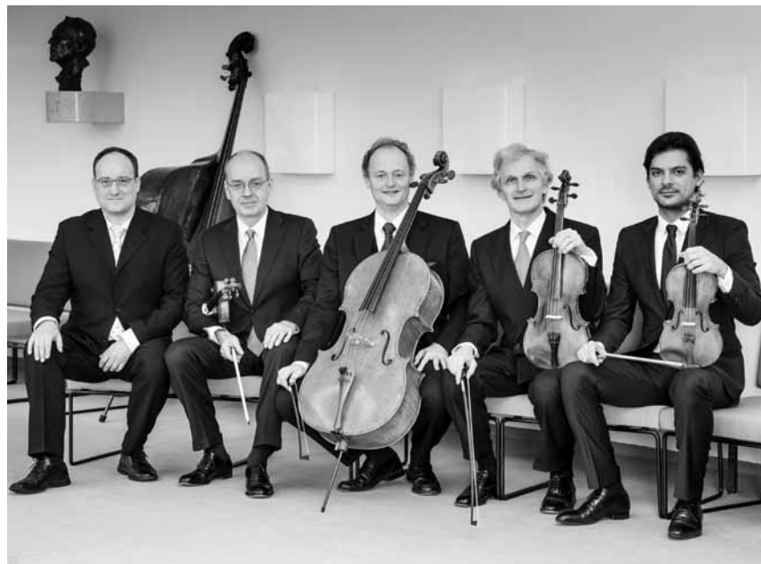
L'église de Bettborn accueillera, ce dimanche 11 septembre à 17 heures, le quintette à cordes du Philharmonique de Berlin qui jouera des œuvres de Mozart, Dvorak, Beethoven, Tchaïkovski et Chostakovitch.