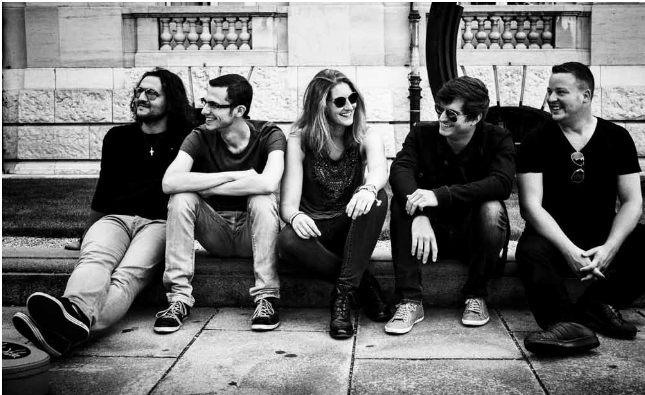
Sur une nouvelle lancée : « Go by Brooks » a évolué du folk intimiste vers des horizons plus rock. La formation présentera son nouvel album « Oceans » le 17 septembre à la Kulturfabrik.

Bonnie & Clyde , das Tufa-Musical 2016, Tufa, Großer Saal, Trier (D) , 20h. Tel. 0049 651 7 18 24 12.