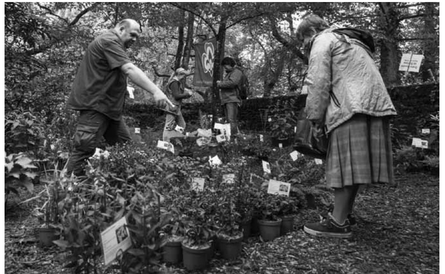
Womit auch schon die heutige Finanzwelt ihren Anfang nahm: Tulpenzwiebeln gibt es sicher auch bei der 16. Pflanzenbörse an Stolzembourg an diesem Samstag und Sonntag.