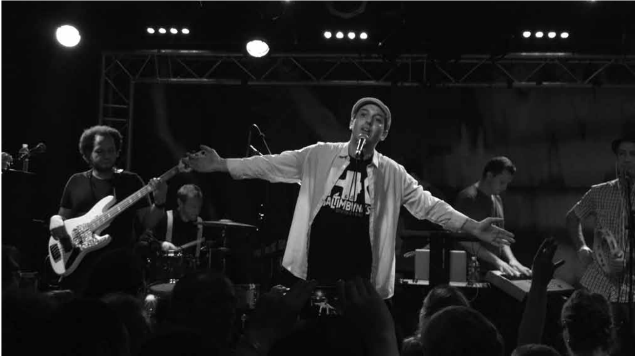
Mit Banken haben „HK et les saltimbanks“ nichts am Hut.