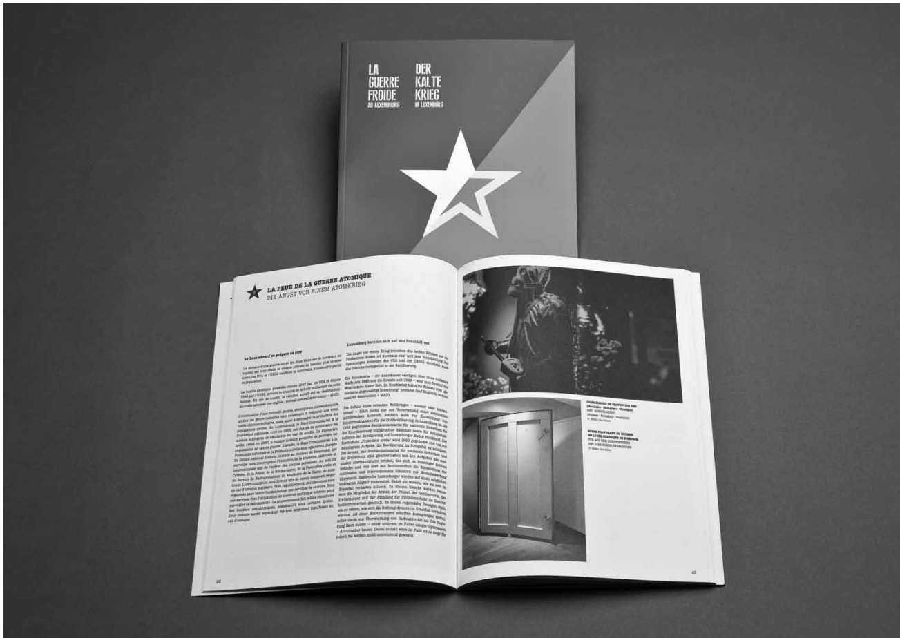
Une excursion dans une période encore trop tabouïlée au Luxembourg : « La guerre froide » au MNHA, prolongation jusqu'au 15 janvier 2017.

14h - 17h et sur rendez vous (galerie Simoncini). Fermé le 1er novembre.