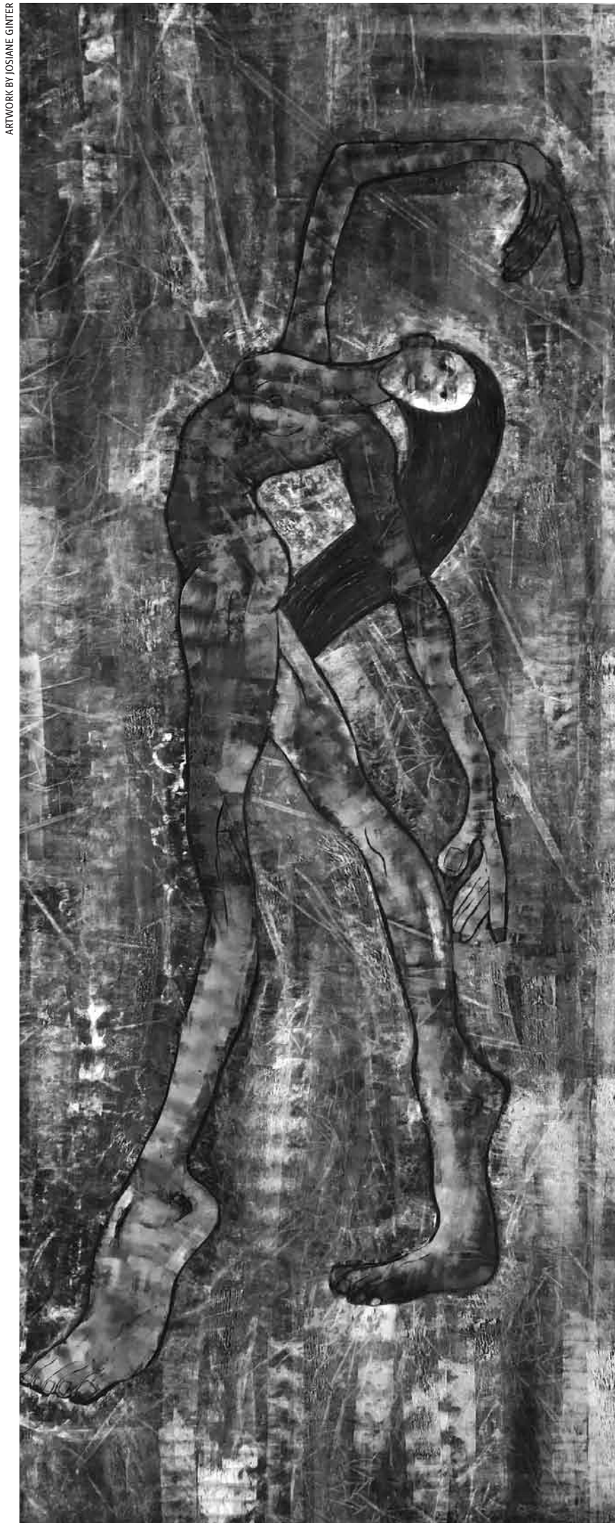
ARTWORK BY JOSIANE GINTER