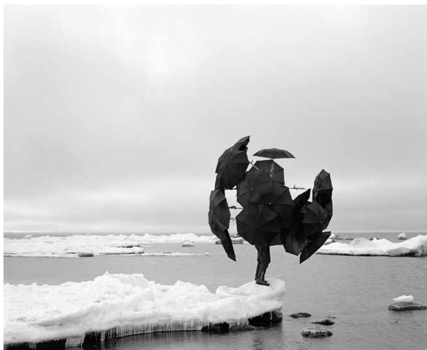
Ein komischer und finnischer Vogel: Janne Lehtinen zeigt ihren „Sacred Bird“ noch bis zum 18. September 2017 in den Arcades II in Clerf.