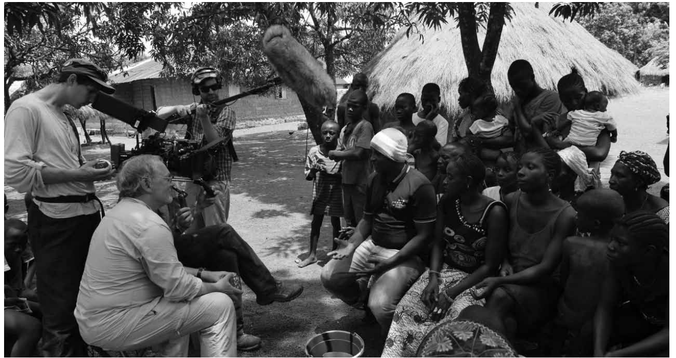
Ein leider wenig beachteter und doch tragischer Aspekt der Globalisierung: „Landraub“ - am Montag in der Cinémathèque.