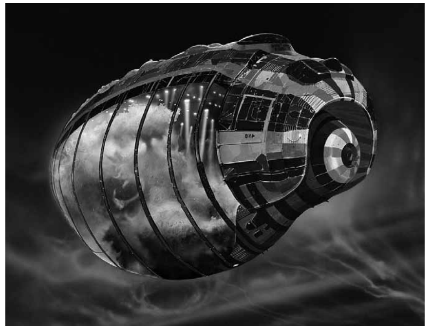
Wäre dieser Film gedreht worden, würde wohl heute niemand über „Star Wars“ reden: „Jodorowsky's Dune“ - Doku über das bekannteste gescheiterte Filmprojekt aller Zeiten, im Starlight.