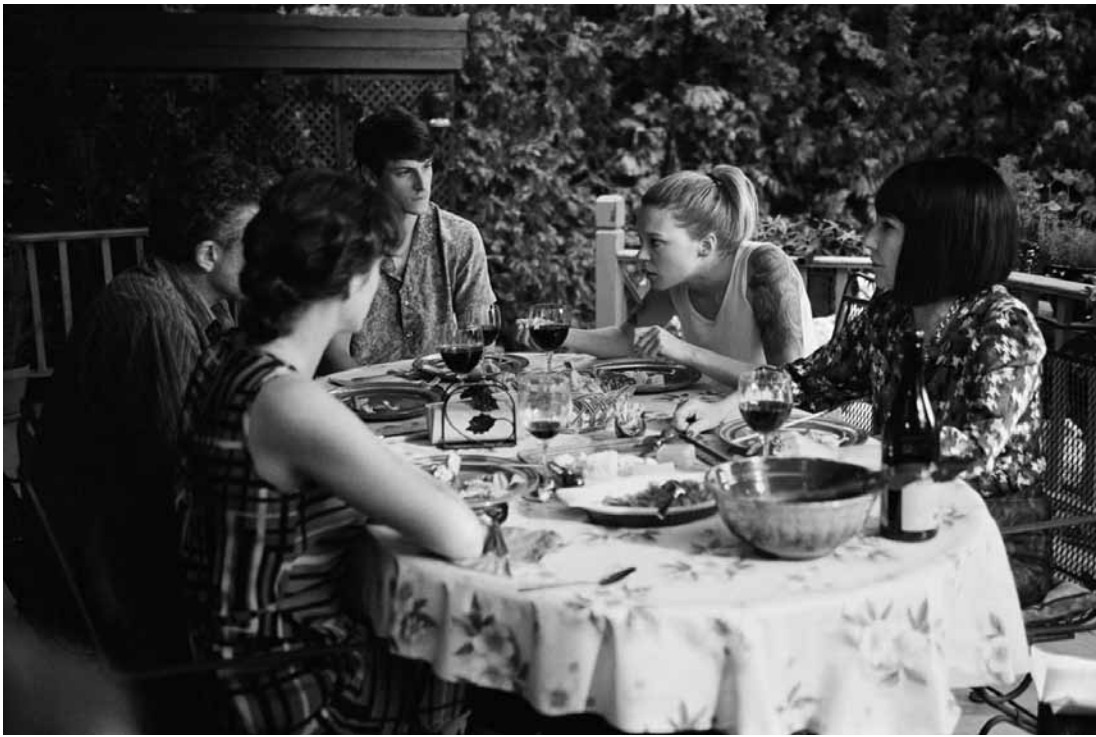
L'un des rares plans larges d'un film où gorges et visages restent serrés en permanence.