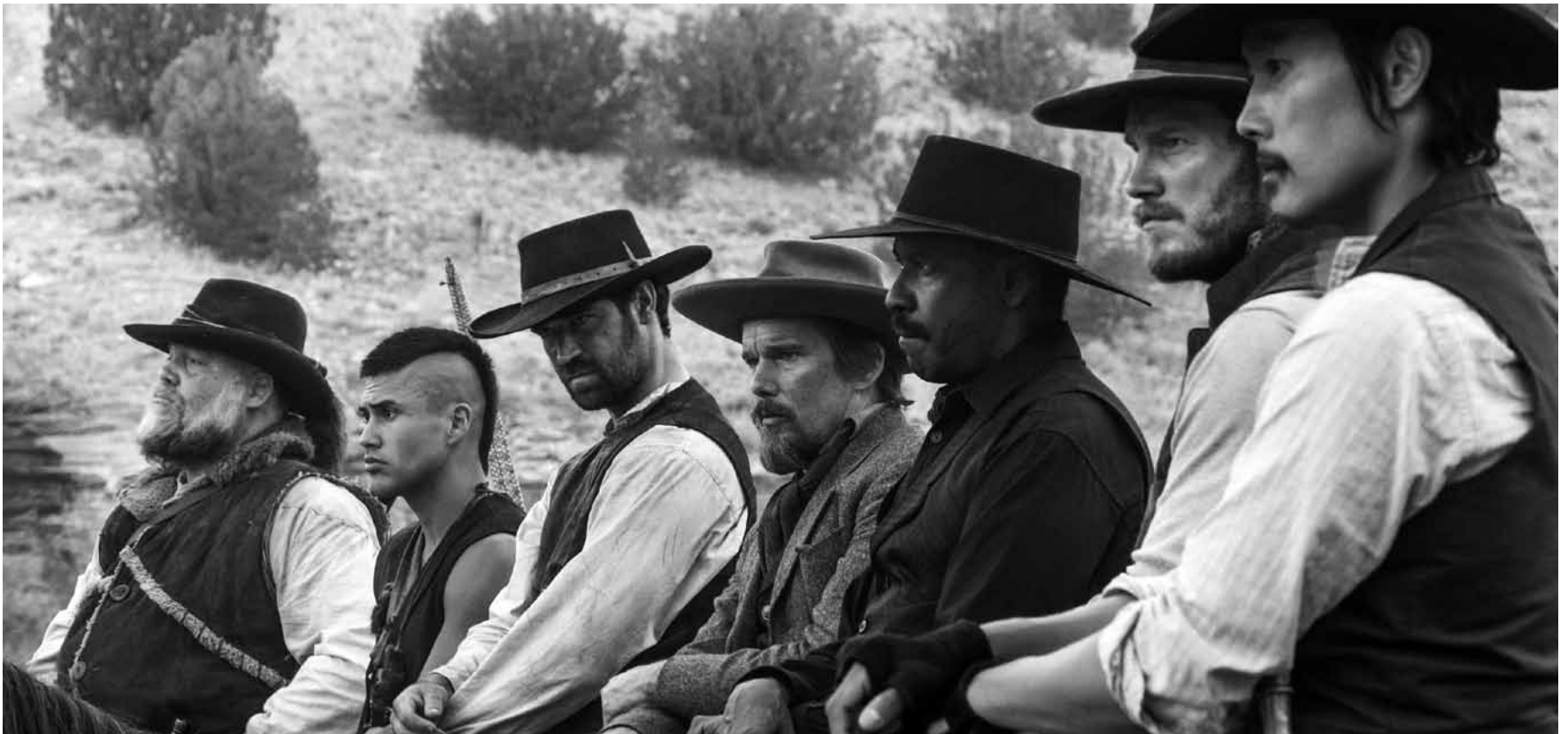
In seinem neuesten Westernremake versucht Regisseur Antoine Fuqua knapp unter dem letzten Tarantino anzusetzen „The Magnificent Seven“ - neu in den Sälen.

von Mama und Papa Monster die klare Ansage, zu Hause zu warten, bis die Eltern von der mysteriösen Eierinsel zurückgekehrt sind, von der sie ein neues Geschwisterchen für Molly holen wollen. Zwei Monsteronkel übernehmen die Aufsicht - können aber auch nicht verhindern, dass Molly und Edison ins Abenteuer ziehen.