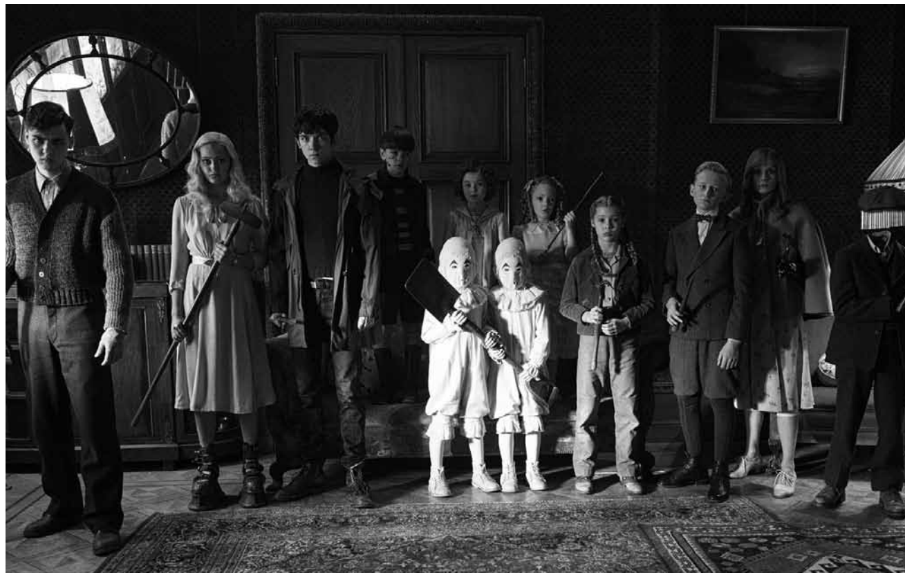
Hat sich Regisseur Tim Burton etwa nach Hogwarts verirrt? „Miss Peregrine's Home for Peculiar Children“ wird die Antwort liefern - neu im Utopolis Kirchberg und Belval.

Beatrice est une mythomane bavarde au comportement excessif. Donatella est une jeune femme tatouée, fragile et introvertie. Ces deux patientes de la Villa Biondi, une institution thérapeutique pour femmes sujettes à des troubles mentaux, se lient