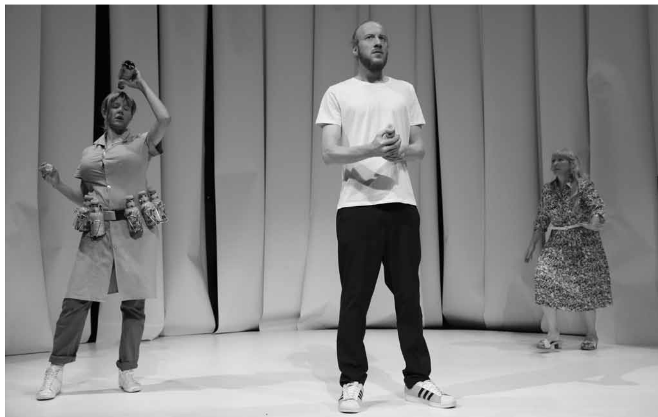
In „Ungefähr gleich“ setzt sich das Theater mit den Lebensbedingungen und Träumen des „Homo economicus“ auseinander - am 28. September und am 4. und 5. Oktober im Kapuzinertheater.

Récital de piano , par Arcadi Volodos, œuvres de Schumann, Brahms et