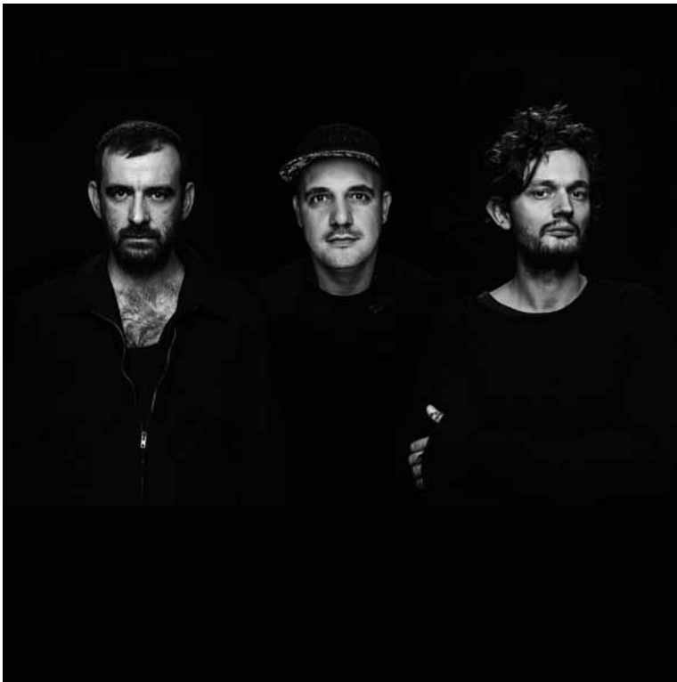
Alles andere als maßvoll: Moderat.