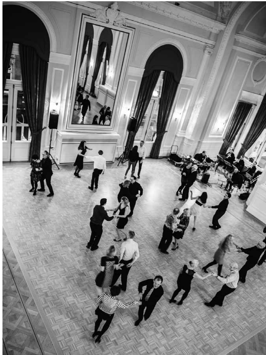
Feiern wie zu Omas Zeiten: Am 9. Oktober organisiert das Cercle Cité einen „Thé dansant“.

Une étagère pour ma collection de miniatures , atelier pour enfants de cinq à douze ans, Casino Luxembourg - Forum d'art contemporain, Luxembourg, 15h. Tél. 22 50 45.