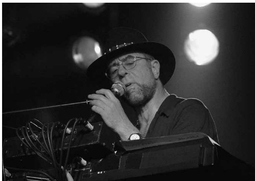
Etwas aus der Kategorie „Gibt's die wirklich immer noch?": Manfred Mann's Earth Band - am 7. Oktober im Lokschruppen in Dillingen.

Andrzej Severyn: Who Are You? an encounter with one of the most renowned Polish actors, salle Robert Krieps au Centre culturel de rencontre Abbaye de Neumünster, Luxembourg,