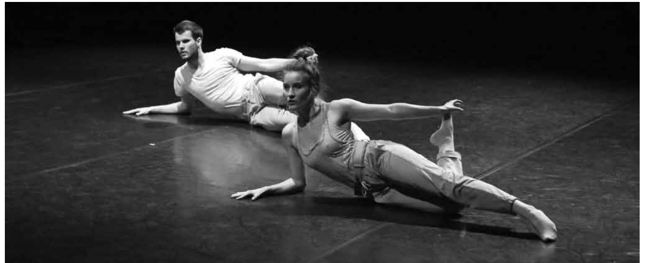
La danse multiple et multipliée : « Trois fois danse-plus » - le 15 octobre au Mierscher Kulturhaus.