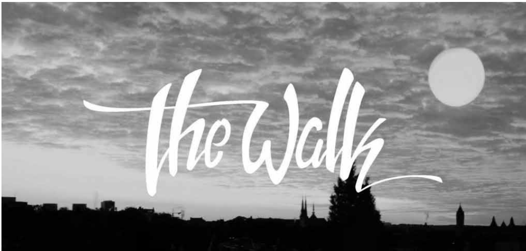
Wandern um der Musik Willen - am Samstag ist es möglich.