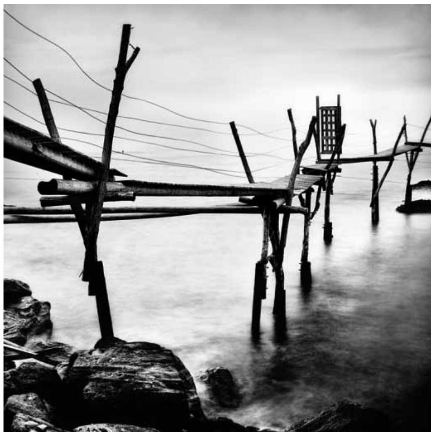
À la Millegalerie de Beckerich, le photographe Gennaro Taddei expose sur un thème qui nous intéresse tous : « Longues pauses » - du 14 octobre au 6 novembre.