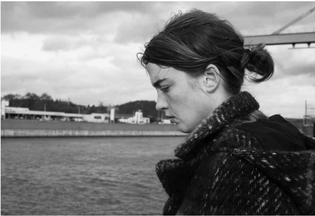
La mélancolie - perpétuelle accompagnatrice du cinéma des frères Dardenne.