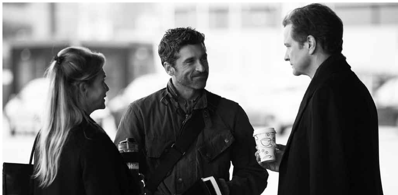
Auch Bridget Jones wird älter und spießiger: „Bridget Jones' Baby“ - neu im Ciné Ermesinde, Ciné Waasserhaus, Kursaal, Utopolis Belval und Kirchberg.

Die Oper spielt im Neapel des 18. Jahrhunderts. Die jungen Offiziere Ferrando und Guglielmo rühmen sich, dass die beiden aus Ferrara stammenden Schwestern Dorabella und Fiordiligi, die sie über alles lieben, ihnen niemals untreu werden könnten.