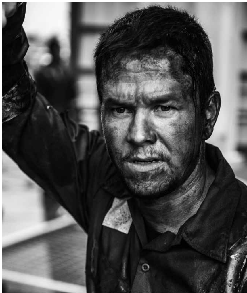
„Deepwater Horizon“ versucht eine der größten Katastrophen der letzten Jahrzehnte als amerikanische Heldengeschichte zu erzählen - neu im Utopolis Kirchberg.

Paul est riche. Émile est pauvre. Ils quittent Aix, « montent » à Paris, pénètrent dans l'intimité de ceux de Montmartre et des Batignolles. Tous hantent les mêmes lieux, dorment avec les mêmes femmes, crachent sur les bourgeois qui le leur rendent bien, se baignent nus, crèvent de faim puis mangent trop, boivent de l'absinthe, dessinent le jour des modèles qu'ils caressent la nuit, font trente heures de train pour un coucher de soleil. ☞ Maladroïtement réalisé et monté, surjoué dans ses parties en flash-back bourrées de noms connus pour impressionner, le film prend un peu d'ampleur sur la fin, lorsque les deux créateurs déjà âgés osent s'envoyer à la figure des vérités pas forcément bonnes à entendre. Mais le mal est déjà fait. (ft)