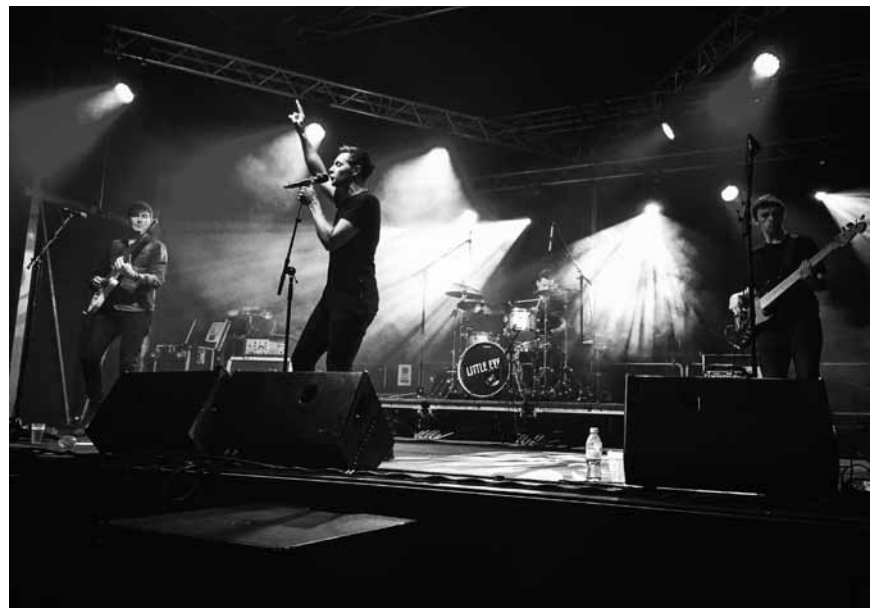
L'Écosse débarque à Metz : les pop-rockeurs de Little Eye seront au « Monkey Show » ce samedi 15 octobre.