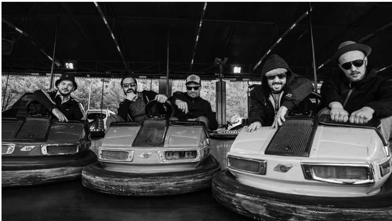
Kirmes für die Ohren: De Läb.