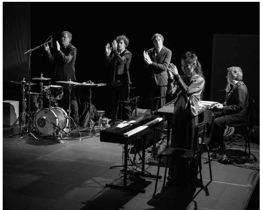
Die Performance-Truppe „Die Redner“ stellt an diesem Freitag, dem 28. Oktober im TNL die Glaubensfrage: „Credo“.