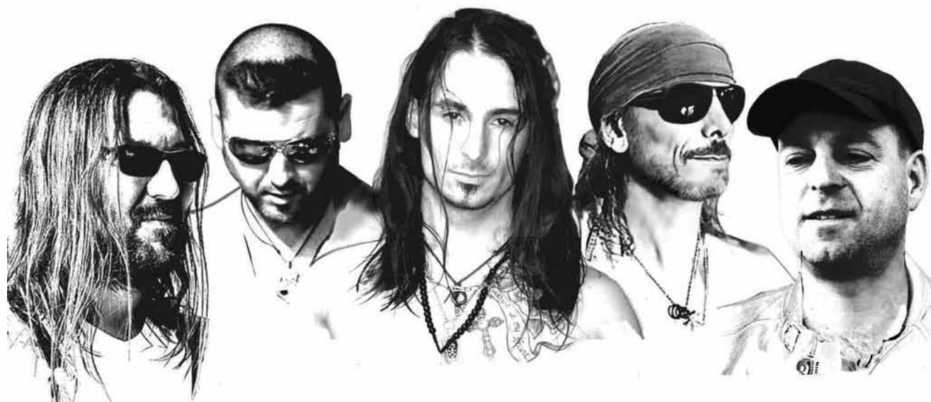
Wenn es mit dem Original so weitergeht, muss man sich eh auf AC/DC-Coverbands einstellen - „Kingstone“ spielen an diesem Samstag, dem 30. November im Little Woodstock in Erzenzen.

Ma cité-message , atelier pour enfants de cinq à douze ans, Casino Luxembourg - Forum d'art contemporain, Luxembourg, 15h. Tél. 22 50 45.