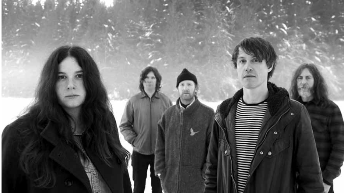
Schwarze Berge versetzen sie: Black Mountain.