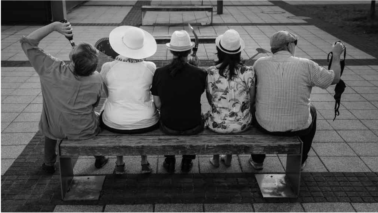
Hierschzäit, Kabarezzäit - an och dëst Joer ass de Kabaret Sténkdéier nees mat derbäi : hire Programm « Schméier! » spille si den 10., 11., 12. an den 13. November am Cube 521 zu Marnech.

20h. Tél. 26 39 51 60 (ma. - ve. 13h - 17h).