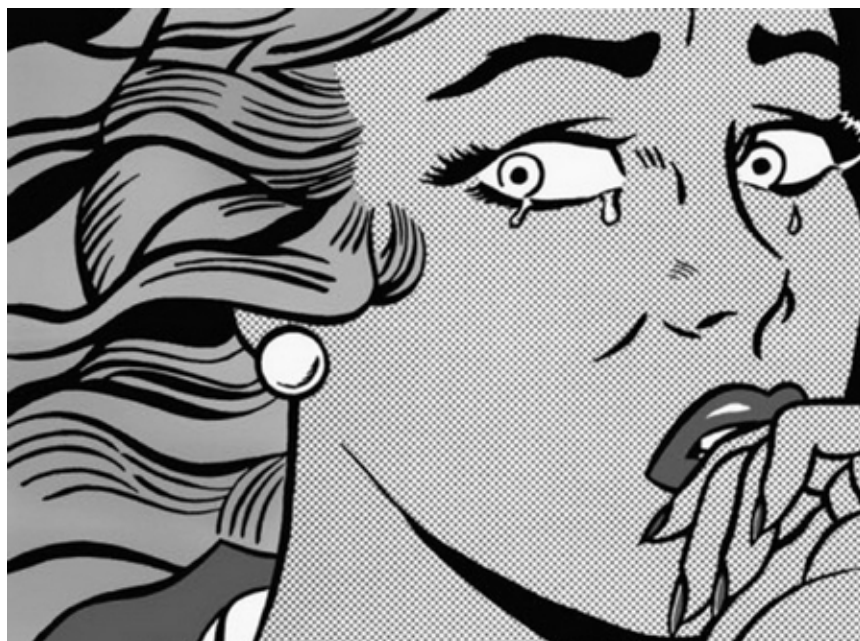
Et flûte! Même les Belges se mettent à l'art moderne... « Andy Warhol, Roy Lichtenstein... la culture américaine des années 50 » - au Palais d'Arlon, jusqu'au 26 février 2017.