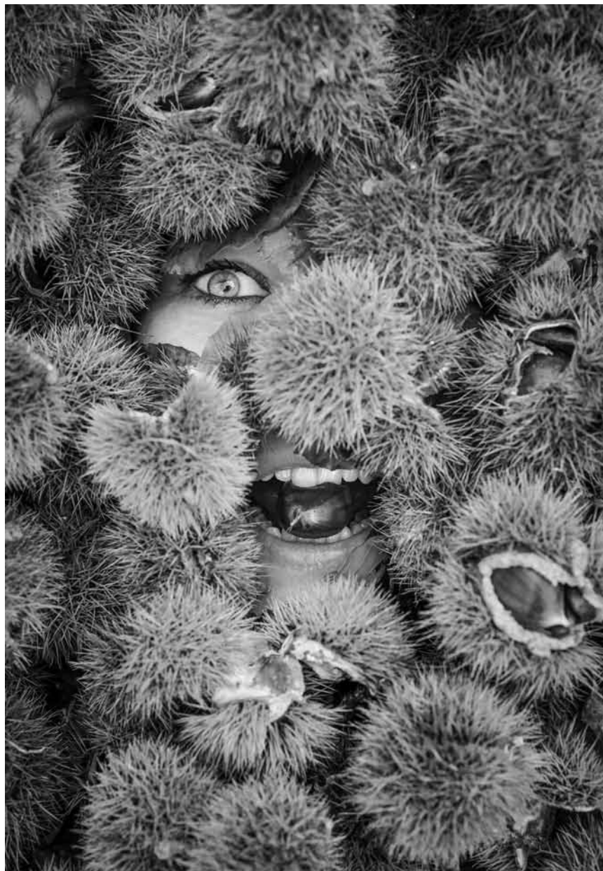
Dans sa série « Under...Ground » le photographe belge Michaël Massart thématise le phantasme ou le traumatisme humain d'être enterré vivant - nouveau à la maison de la culture d'Arlon, du 25 novembre au 23 décembre.