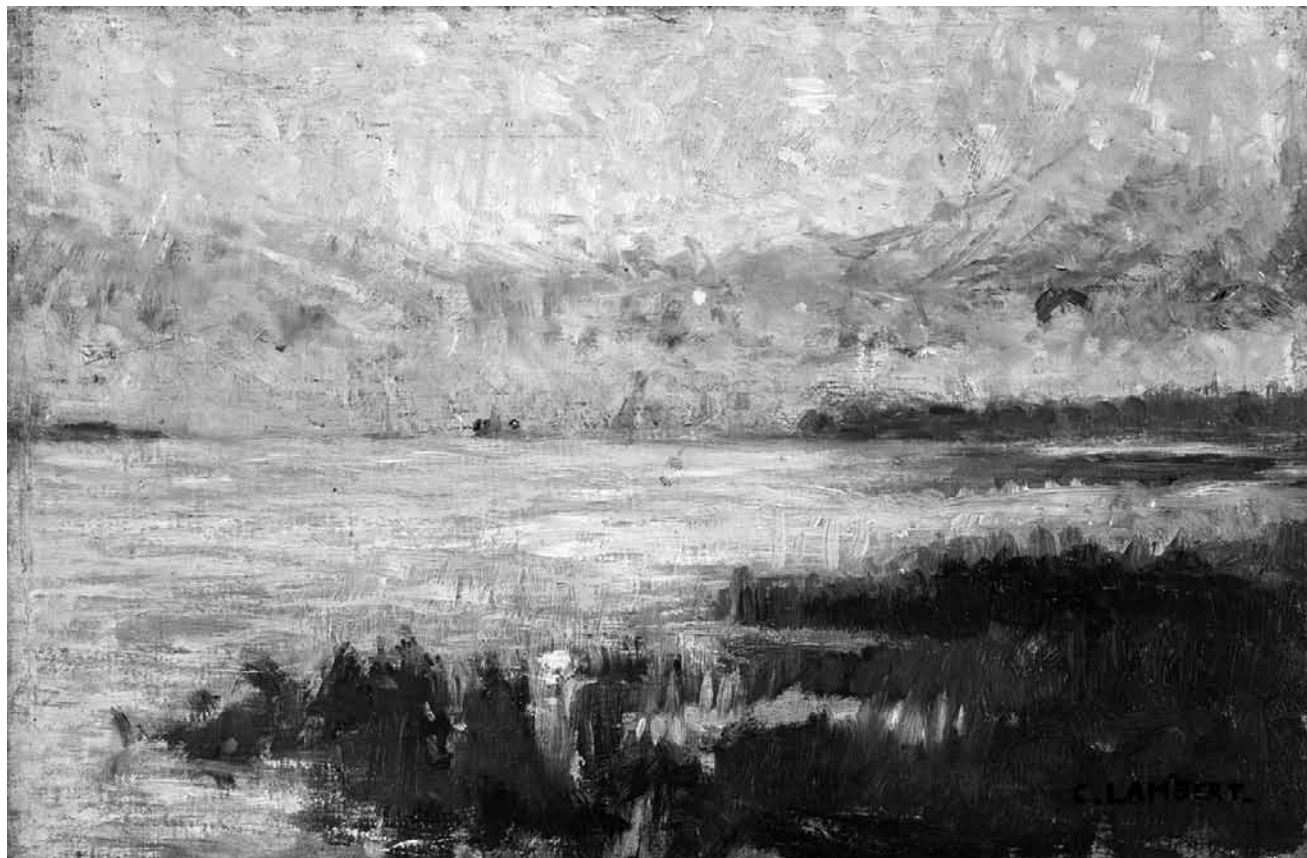
La Villa Vauban fait place aux « Espaces d'artistes », les donations et acquisitions récentes peuvent être admirées jusqu'au 15 janvier 2017.

Nosbaum Reding Projects (4, rue Wilhelm, tél. 26 19 05 55), jusqu'au 7.1.2017, ma. - sa. 11h - 18h.