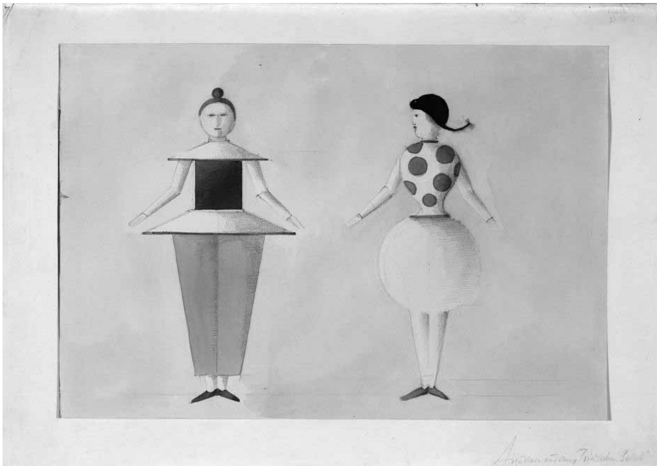
Le danseur du Bauhaus : l'artiste et chorégraphe allemand Oskar Schlemmer est à l'honneur du Centre Pompidou de Metz, jusqu'au 16 janvier 2017.

bis zum 5.3.2017, Di., Do. - So. 10h - 18h, Mi. 10h - 22h.