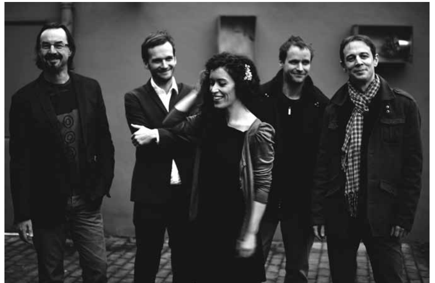
Un tout nouveau set pour le Marly Marques Quintet ! Il sera présenté au public ce vendredi 2 décembre au Kulturhaus Niederanven.