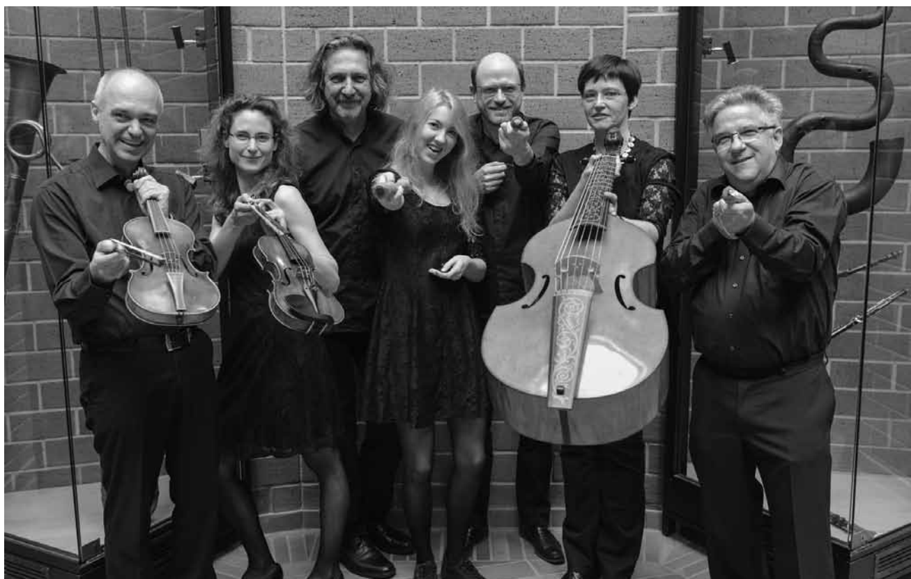
Barockmusik gleich doppelt: „Ad libitum“ spielen Werke von Bononcini, Fux, Couperin, Hasse und Janitsch - am 10. Dezember in der Waxweiler Kirche und am 11. Dezember in der Kirche in Heiderscheid.

Karpatt + Les Escrocs , Le Gueulard plus (3, rue Victor Hugo), Nilvange (F) , 20h30. Tél. 0033 3 82 54 07 07.