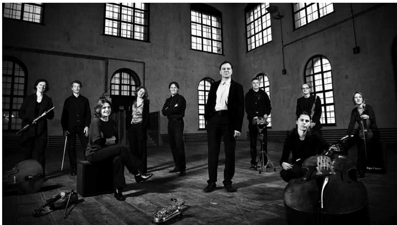
Le mois de décembre a aussi ses petits délices pour les amateurs de nouvelles musiques : « Forêt profonde », par l'Ensemble Noise Watchers Acousmonium et Tuba Consortium Luxembourg, ce dimanche 4 décembre au Mudam dans le cadre des « Rainy Days ».

Beam , jazz, brasserie Le Neumünster (Centre culturel de rencontre Abbaye