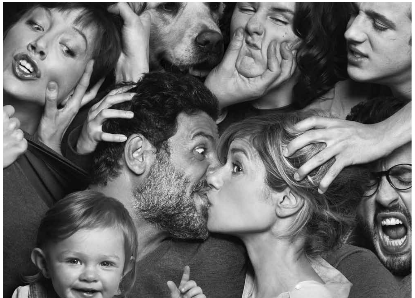
Séparations, divorces et blagues salaces seront au rendez-vous dans « Papa ou maman 2 » - nouveau à l'Utopolis Belval et Kirchberg.

Dieu ne joue pas aux dés. Mais les banquiers, oui. C'est peut-être pour cela que le moine de l'ordre des Chartreux Roberto Salus a été invité en secret à une réunion du G8, avec une rock star et une auteure de best-sellers pour enfants.