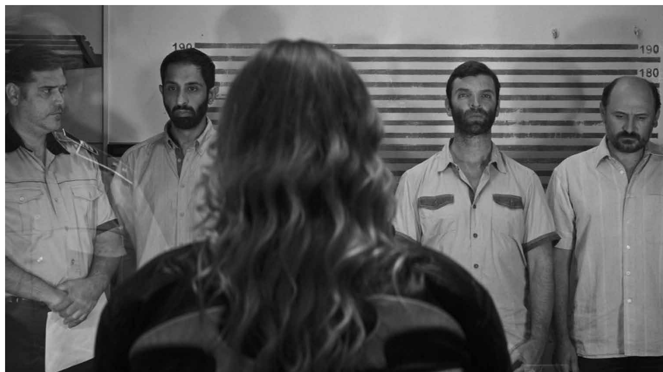
Christian Mungiu développe la perspective roumaine sur quelque chose qui nous semble acquis : « Bacalaureat » - nouveau à l'Utopia.