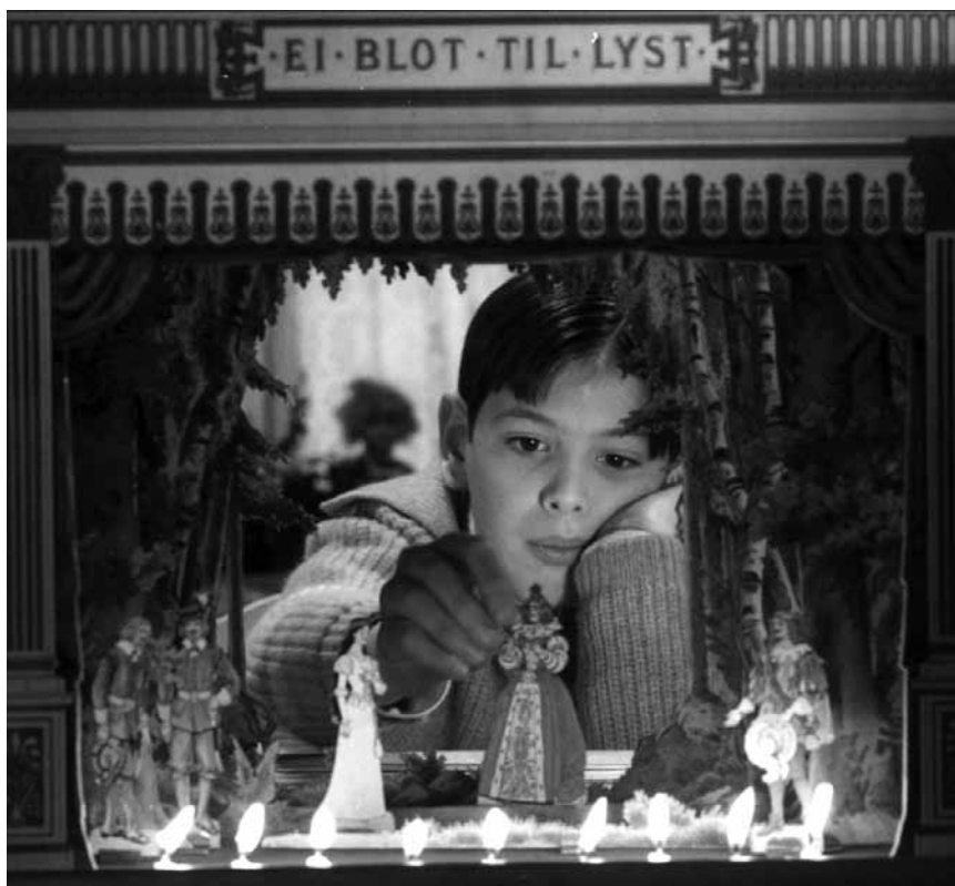
Un Noël classique : « Fanny och Alexander » d'Ingmar Bergmann, samedi à la Cinémathèque.