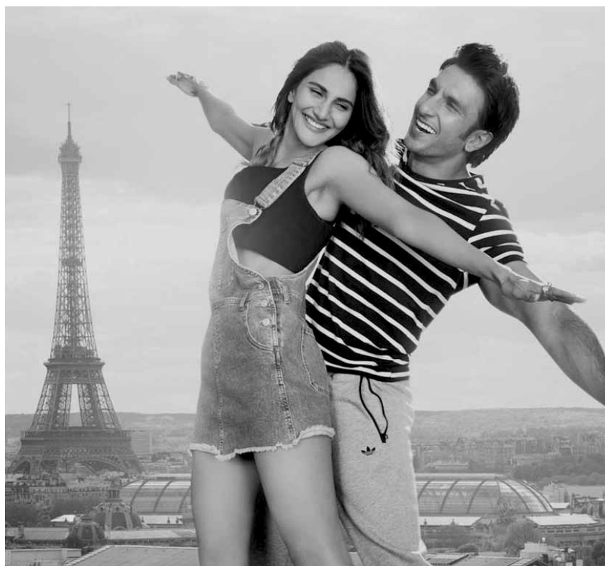
When Bollywood meets Paris ... "Bekfire" - at Utopolis Belval as part of the "Bollywood Cycle".