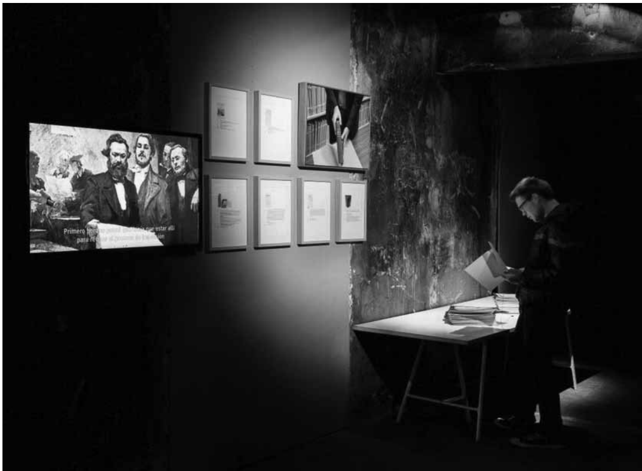
L'exposition plutôt politique de Cristina Lucas « Trading Transcendence » est à voir au Mudam encore jusqu'au 14 mai 2017.