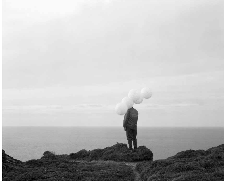
Nicht nur Luft im Kopf: „Sacred Bird“ - die Fotos von Janne Lehtinen sind noch bis zum 18. September 2017 in Klerf in den Arcades II zu sehen.