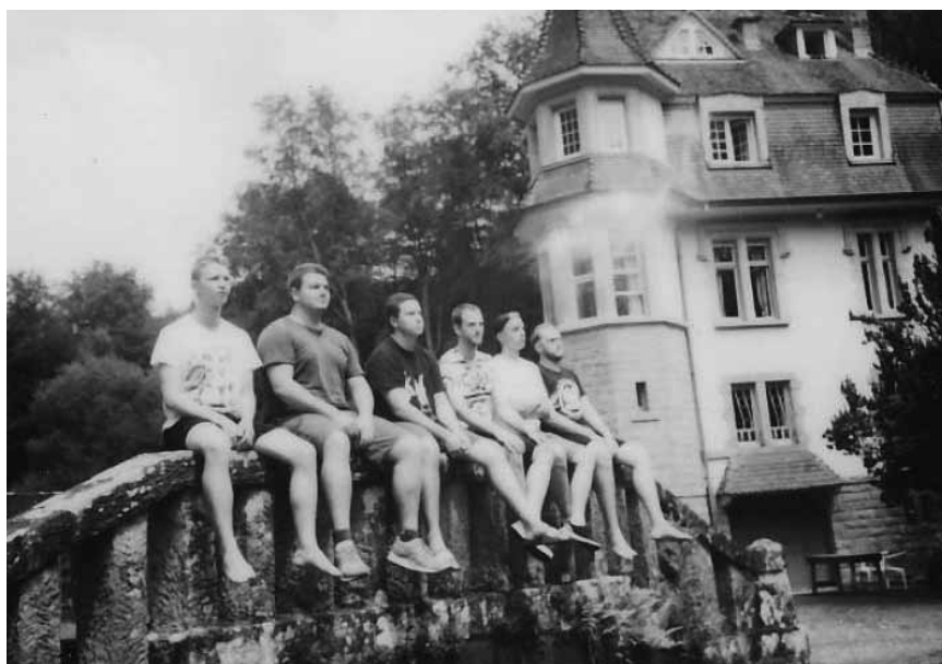
Do gett dann nach massiv Zodi geschloen : « Răpzodi » akustischen Hip-Hop op lëtzebuergesch, den 25. Dezember am Centaure.

Der Freischütz , Oper von Carl Maria von Weber, Saarländisches Staatstheater, Saarbrücken (D), 19h30. Tel. 0049 681 30 92-0.