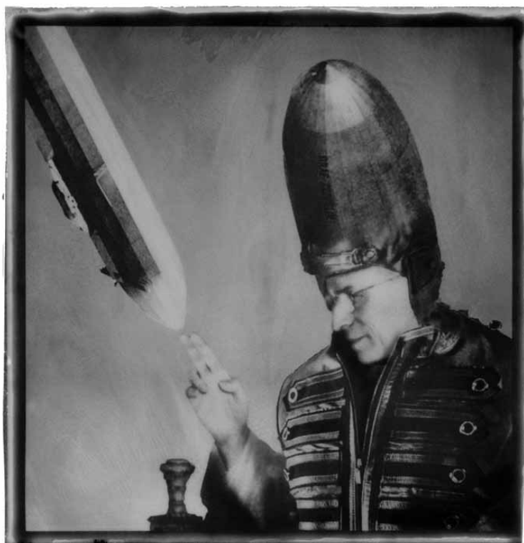
Pope's leisure wear designed by Maxime de la Falaise

Fotograf Luc Ewen's „The Zeppelin Story“ ist noch bis zum 14. April 2017 in der wArtehalle in Welchenhausen zu erleben.