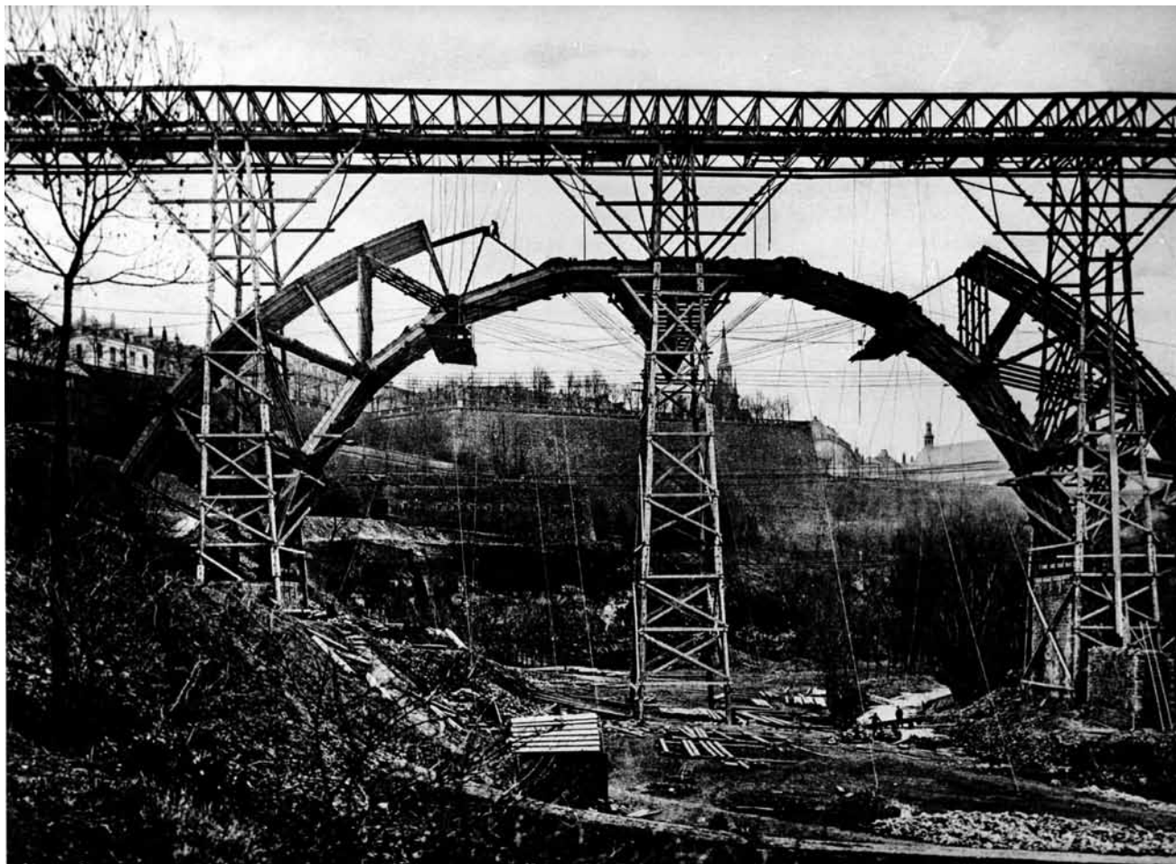
Vu que les travaux seront - qui l'eût cru ? - bien sûr à la traîne, mieux vaut passer au Musée Dräi Eechelen si on a la nostalgie du « Pont Adolphe 1903 » - encore jusqu'au 8 mai 2017.