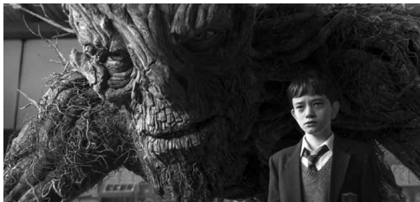
Manchmal braucht es ein Monster um die verborgenen Ängste in sich zu materialisieren: „A Monster Calls“ - neu im Utopolis Belval und Kirchberg.