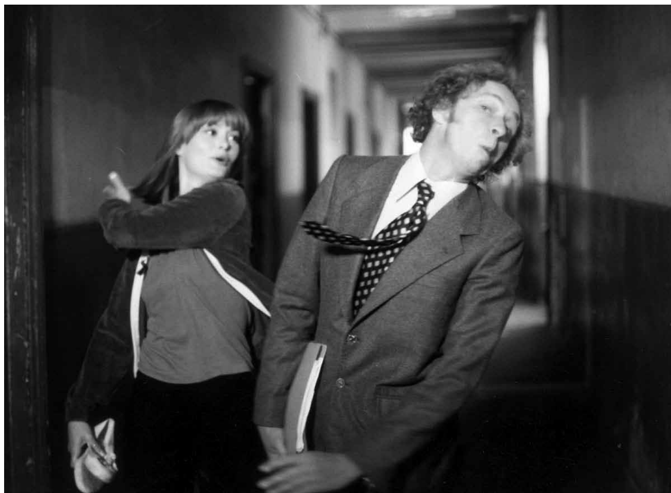
Pierre Richard au comble de son art : « La moutarde me monte au nez » - vendredi à la Cinémathèque.

Professeur distrait dans un pensionnat de jeunes filles, Pierre écrit à la fois les discours de son père, maire de la