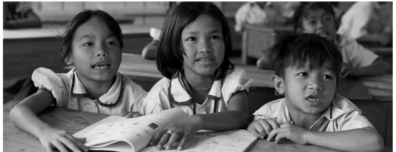
20 ans de combat pour améliorer le destin des enfants oubliés du Cambodge : « Les pépites », documentaire de Xavier de Lauzanne, nouveau à l'Utopia.

Die wahre Geschichte über den amerikanischen Army-Sanitäter Desmond T. Doss, der sich im Zweiten Weltkrieg als erster Soldat dem Dienst verweigerte und keine Waffen tragen wollte. Er wurde vor ein Gericht gestellt und musste zurück an die Front. Doch zurück bei den anderen Soldaten, wurde Doss erst einmal zum Opfer deren Repressalien. Während eines Angriffs auf seine Einheit wuchs er dann über sich hinaus und rettete im Kampf um Okinawa unter permanentem Beschuss des Gegners mehr als 75 seiner Kameraden.