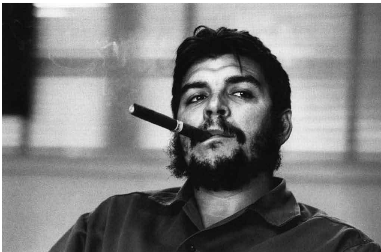
La révolution est morte, vive la révolution ! La galerie Clairefontaine propagera la « Cuban Revolution » - du 19 janvier au 25 février.

l'exposition 'La guerre froide au Luxembourg' a d'abord le mérite d'exister. (...) à voir, de préférence en visite guidée. » (lm)