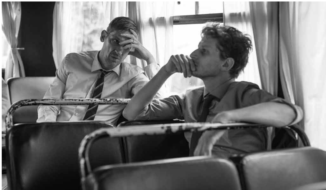
Quand les Belges s'y mettent, leur roi n'est pas la limite : « King of the Belgians », une comédie qui promet - nouveau au Ciné Ermesinde, Ciné Waasserhaus et Kursaal.

Turin, 1969. Massimo, un jeune garçon de neuf ans, perd sa mère dans des