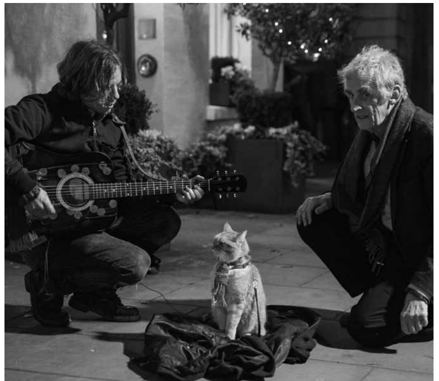
In „A Street Cat Named Bob“ mausert sich ein streunender Kater zum Sozialarbeiter - neu im Utopia.