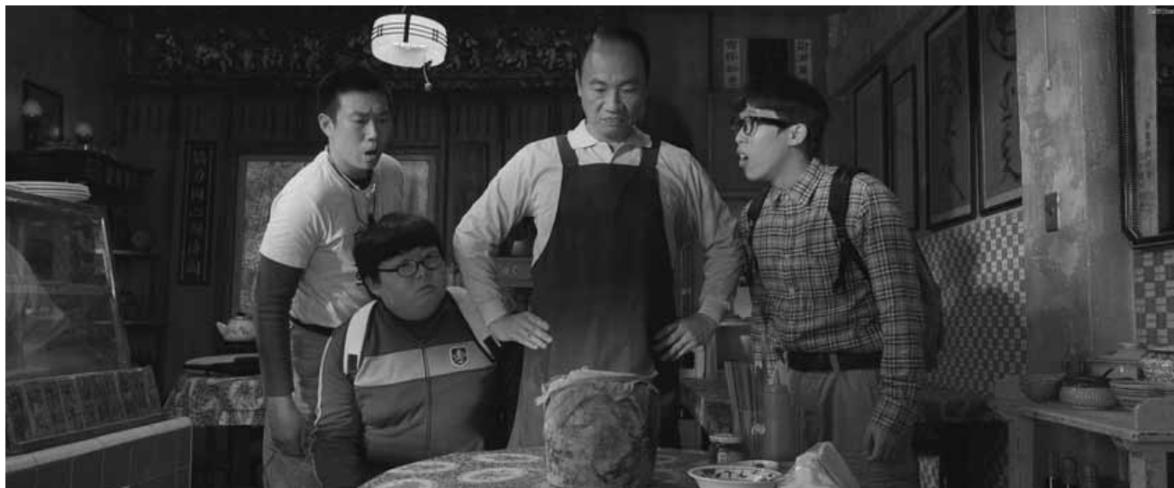
Reviving the outdoor banquet business is not as easy as it sounds... "Zong pu shi" will be shown Saturday at the Cinémathèque.

un accident qui en a fait un simple d'esprit.