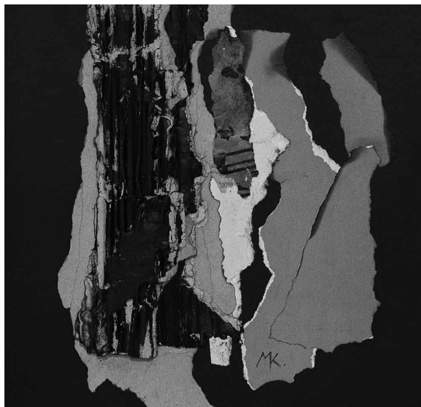
C'est pas « No Woman, No Cry » au Aalt Stadhaus à Differdange, mais tout le contraire - l'expo « Crying Women » de Monique Kemp y est à voir jusqu'au 4 février.