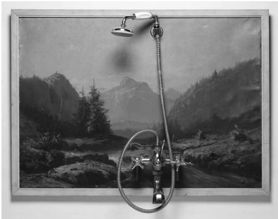
« La douche » de Daniel Spoerri.