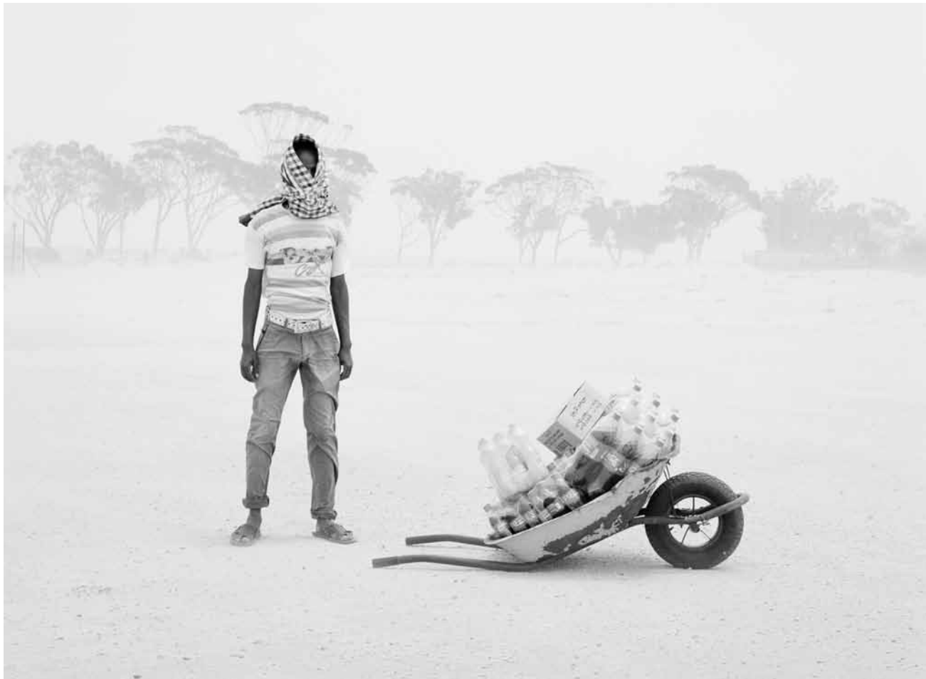
Le photographe Samuel Gratacap s'intéresse de près aux phénomènes de la migration : « Timescape » sera au Mudam du 10 février au 14 mai.

sublimation du réel - qu'il soit vécu ou vu à la télé importe peu -, le peintre confronte le public à ses propres émotions en le mettant en porte-à-faux, entre lui-même et le sujet peint. Il le contraint en quelque sorte à une réaction. Un procédé fort et qui marche sans artifices. » (lc)